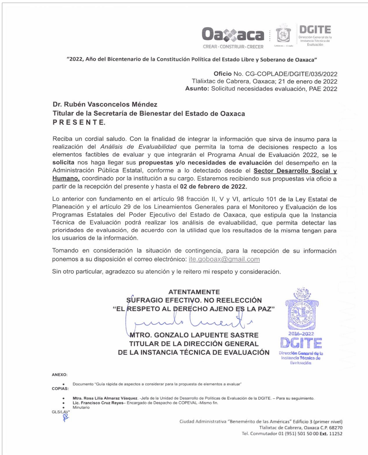
Figura 2. Ejemplo de oficio enviado.

en caso de que fuera aprobada su propuesta de evaluación. Para esto, se generó el documento denominado "Guía rápida de aspectos a considerar para las propuestas de elementos a evaluar, PAE 2022", el cual se anexó a los oficios donde se les solicitaban dichas necesidades.