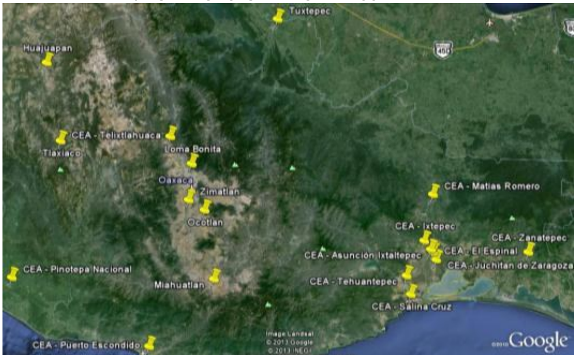
MAPAS 2 Y 3 18 CIUDADES CONURBADAS A CARGO DE LA CEA

c) Infraestructura Hidráulica: Mejora en la infraestructura de los servicios de agua en 18 ciudades intermedias del estado de Oaxaca. Las actividades del Programa tendrán el objetivo de mejorar la calidad del suministro y la sostenibilidad financiera de los organismos operadores que trabajan en las 18 ciudades intermedias seleccionadas, situadas fuera de la zona metropolitana de Oaxaca. La mayoría de este grupo de ciudades tienen más de 15,000 habitantes y las modalidades de operación de sus sistemas operadores es a través de la CEA o de los municipios. Los operadores de agua participantes brindan servicio a cerca del 50% del total de la población urbana del estado que habita fuera de la zona metropolitana de Oaxaca, esto es, cerca de 600,000 beneficiarios. La planificación de las actividades que se financiarán en cada ciudad se basará en diagnósticos y planes maestros. Las ciudades intermedias son: Heroica Ciudad de Huajuapán de León, Loma Bonita, Miahuatlán de Porfirio Díaz, Ocotlán de Morelos, San Juan Bautista Tuxtepec, Heroica Ciudad de Tlaxiaco, Zimatlán de Álvarez, Asunción Ixtaltepec, Ciudad Ixtepec, El Espinal, Heroica Ciudad de Juchitán de Zaragoza, Matías Romero Avendaño, Salina Cruz, San Francisco Telixtlahuaca, Puerto Escondido, Santiago Pinotepa Nacional, Santo Domingo Tehuantepec y Santo Domingo Zanatepec.