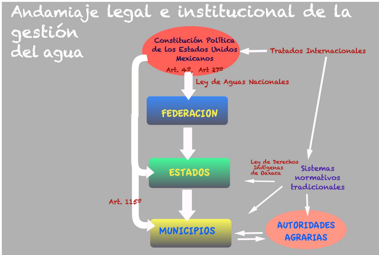
CUADRO 2 ANDAMIAJE LEGAL E INSTITUCIONAL DE LA GESTIÓN DEL AGUA

Existen en México leyes, reglamento y normas oficiales que cubren todos los aspectos de la gestión ambiental, tanto a nivel federal como estatal y en muchos casos municipal.