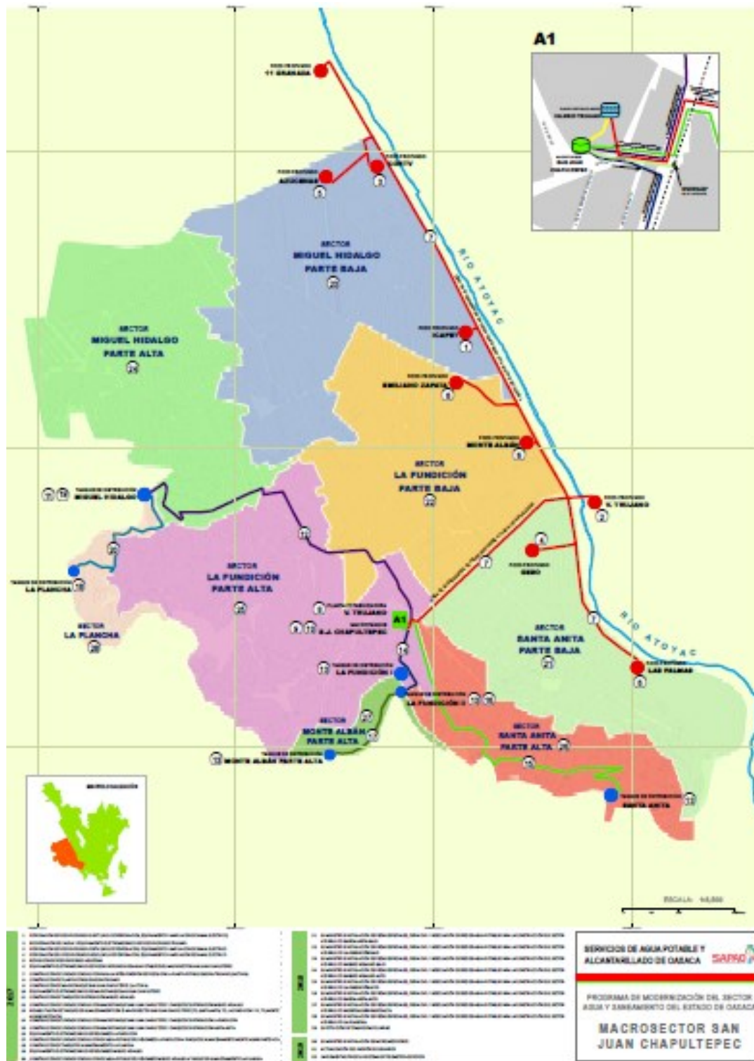
MAPA 1 MEJORAMIENTO DE LA ZONA METROPOLITANA DE OAXACA DE JUÁREZ