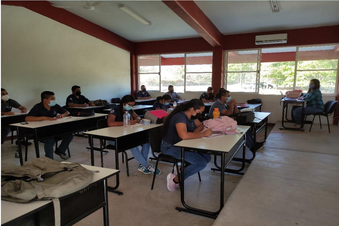
Fotografía 11: Capacitaciones a los alumnos de la Licenciatura en Medicina Veterinaria