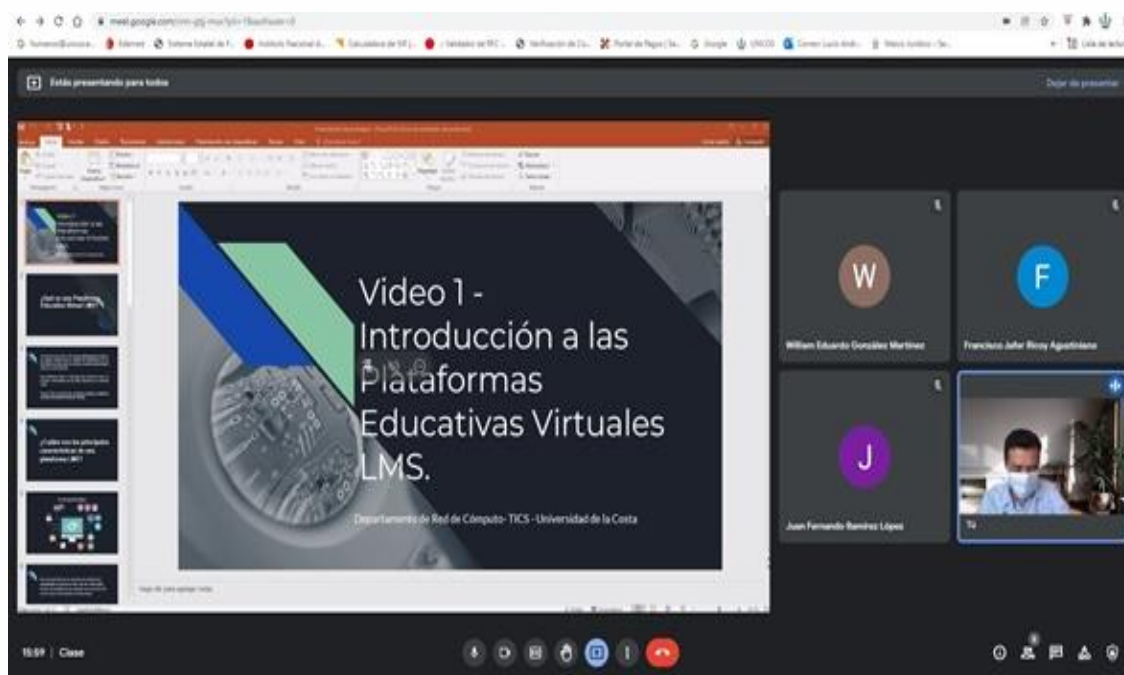
Fotografía 5: Capacitaciones virtuales a los alumnos de la Licenciatura en Ciencias Empresariales

Cursos de capacitación de manera virtual a los alumnos de nuevo ingreso de la Licenciatura en Ciencias Empresariales.