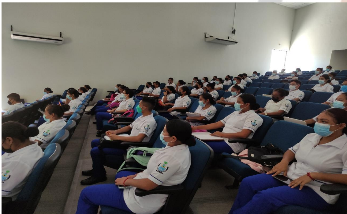
Fotografía 4: Capacitación en el auditorio de la Universidad de la Costa.