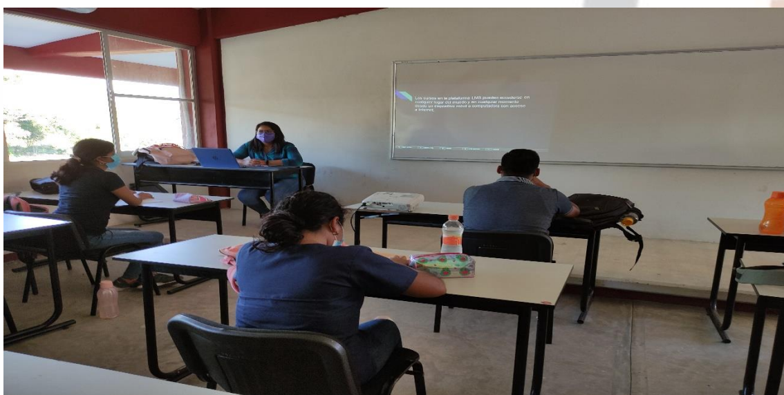
Fotografía 10: Capacitaciones a los alumnos de la Licenciatura en Medicina Veterinaria