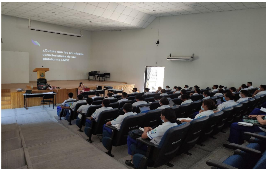
Fotografía 1: Capacitación en el auditorio de la Universidad de la Costa