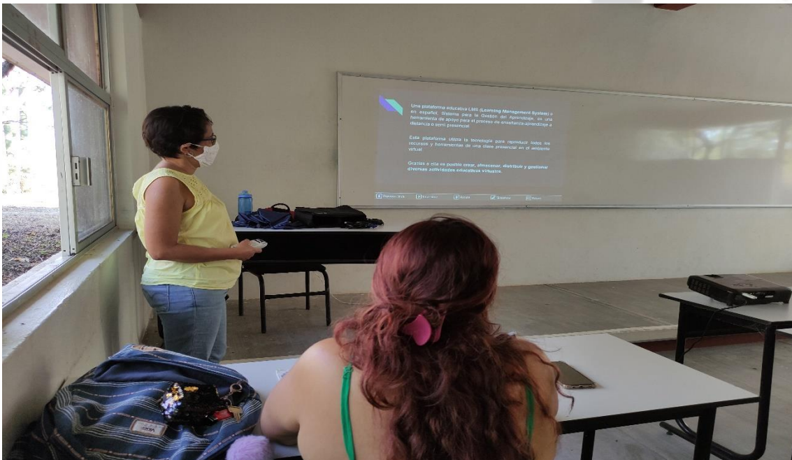
Fotografía 12: Capacitaciones a los alumnos de la ingeniería en Agroindustrias