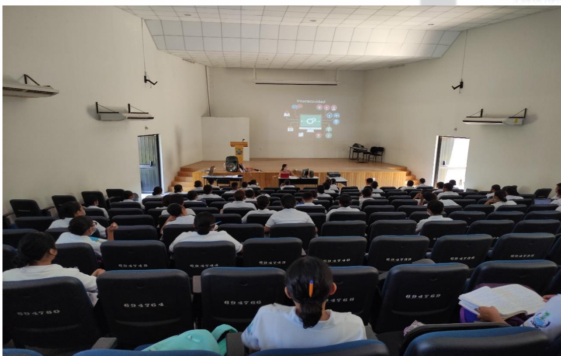
Fotografía 2: Capacitación en el auditorio de la Universidad de la Costa.