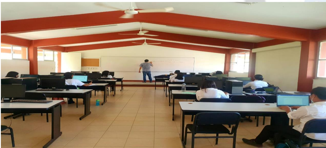
Fotografía 8: Capacitaciones virtuales a los alumnos de la Ingeniería en Diseño.