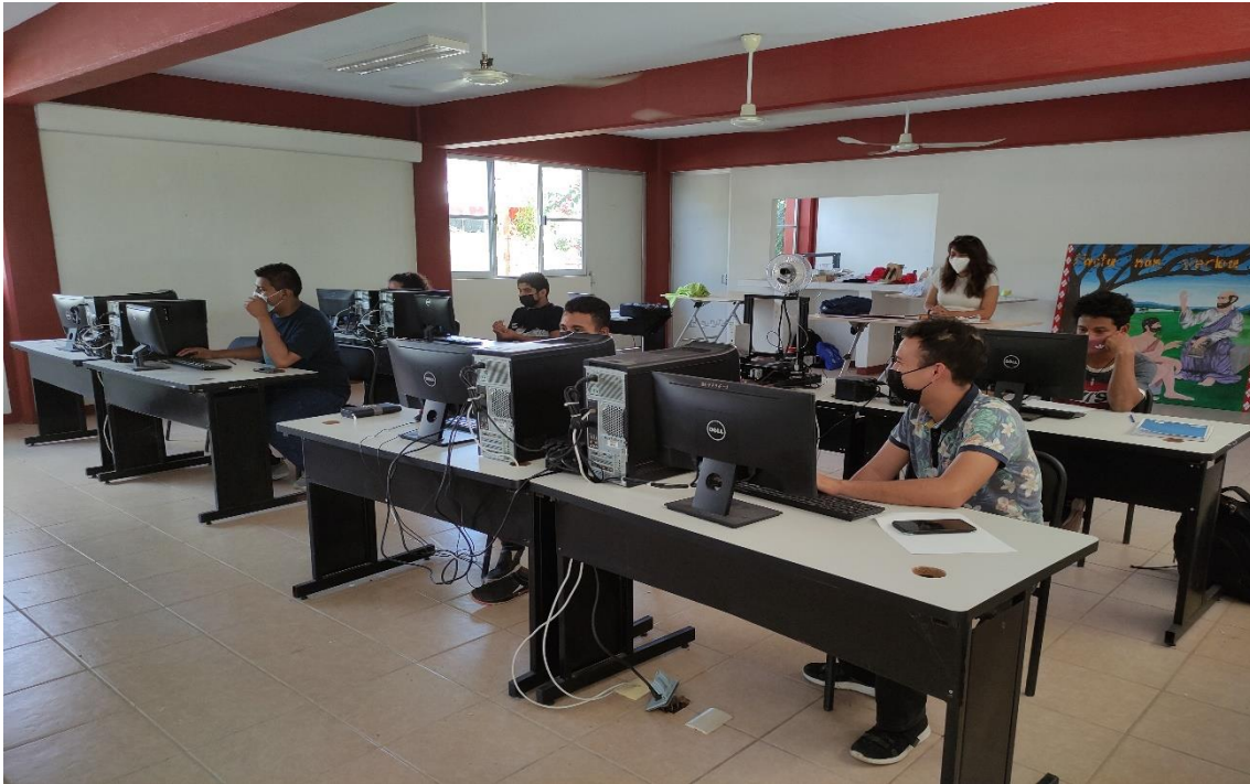
Fotografía 7: Capacitaciones virtuales a los alumnos de la Ingeniería en Diseño.

Capacitación a los alumnos de nuevo ingreso de la Ingeniería en Diseño.