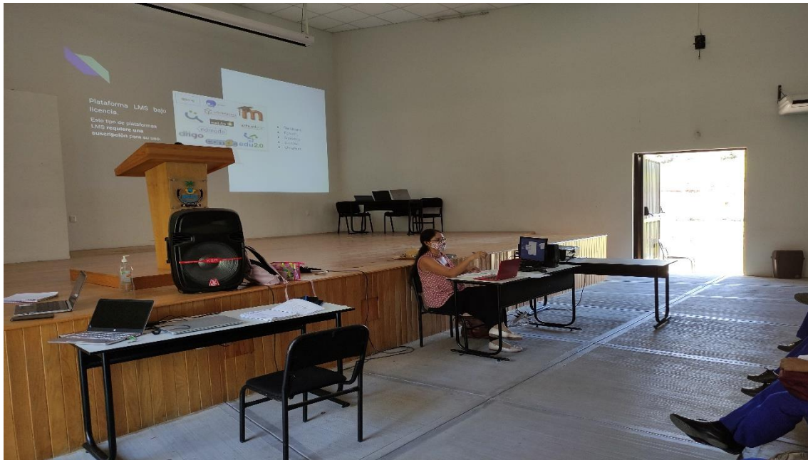
Fotografía 3: Capacitación en el auditorio de la Universidad de la Costa.