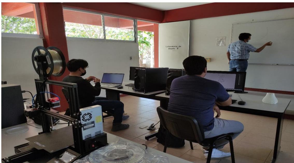
Fotografía 9: Capacitaciones a los alumnos de la Licenciatura en Medicina Veterinaria.