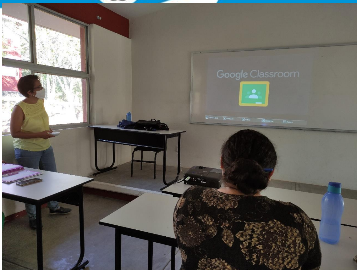
Fotografía 13: Capacitaciones a los alumnos de la ingeniería en Agroindustrias