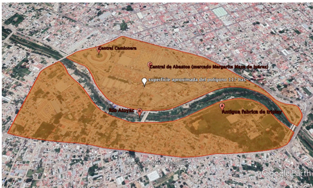
Ilustración 3 Áreas de Intervención

En la zona del Mercado Margarita Maza de Juárez se propondrán proyectos a nivel conceptual de andadores de las avenidas cercanas a dicho Mercado y proyectos que ayuden a la movilidad de las avenidas que confluyen al Mercado. Así mismo se propondrán a nivel conceptual proyectos para ordenar el comercio ambulante que prolifera en la zona.