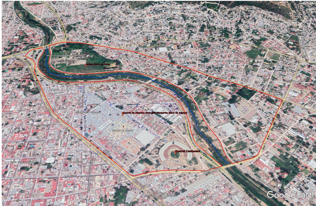
Ilustración 2 Área de Intervención, Polígono de la Zona de la Central de Abasto.

En virtud de tratarse de un proyecto de Regeneración Urbana, de la zona de la central de abastos; el estudio, para el entendimiento de la zona, abarca una poligonal delimitada por las calles Valerio Trujano al poniente, periférico al norte, el puente Porfirio Díaz al oriente y la calle de Monte Albán al sur , equivalente a 117 hectáreas aproximadamente.