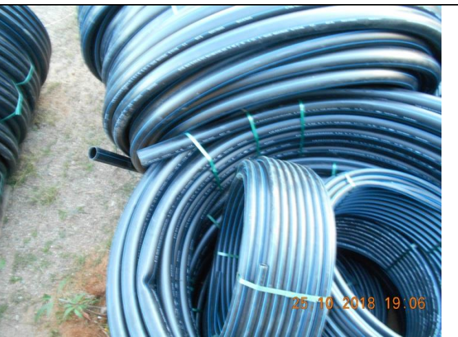
Suministro de tubería de 1" RD 13.5