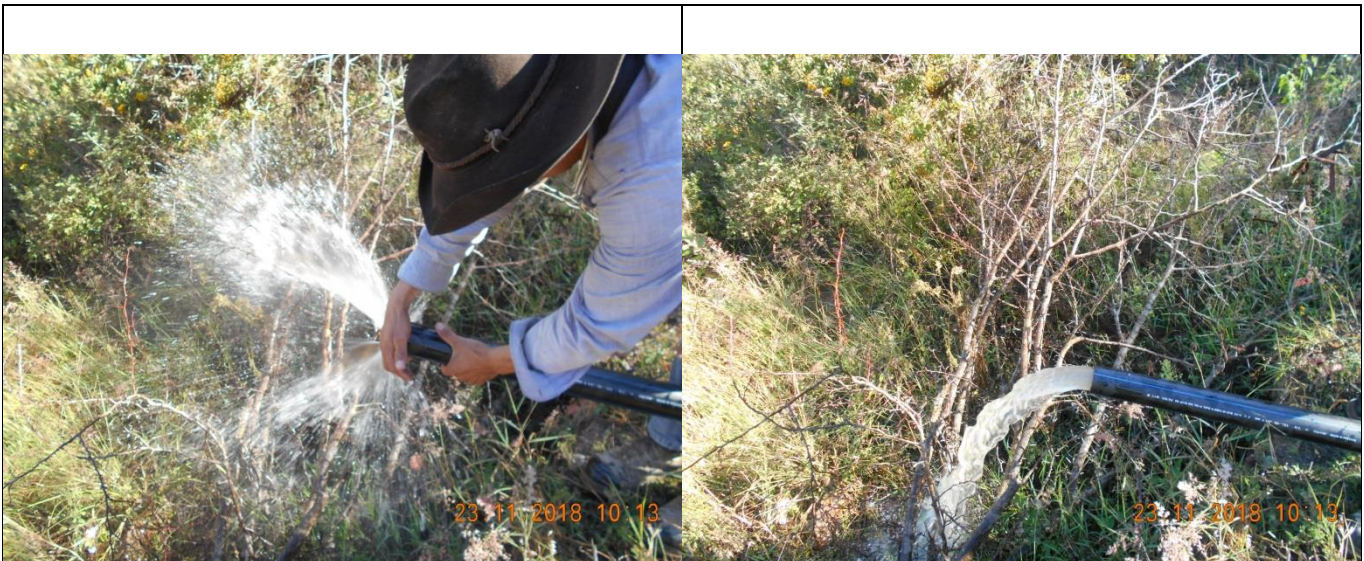
Prueba hidráulica de la línea de conducción en el ramal 1 "Portillo del gallo"