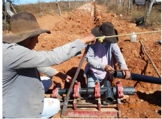
Colocación de piezas especiales (Stub End y Tee).