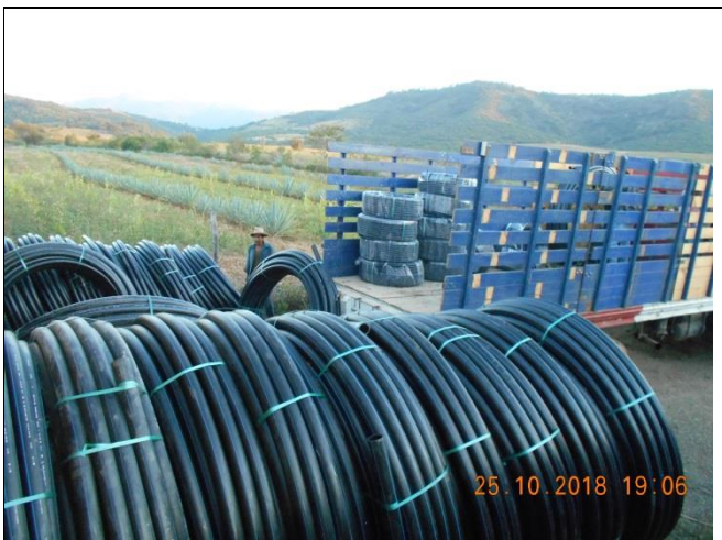
Suministro de tubería de 2" RD 11