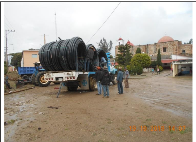
Acarreo de tubería de 3" RD 17 al sitio de obra.