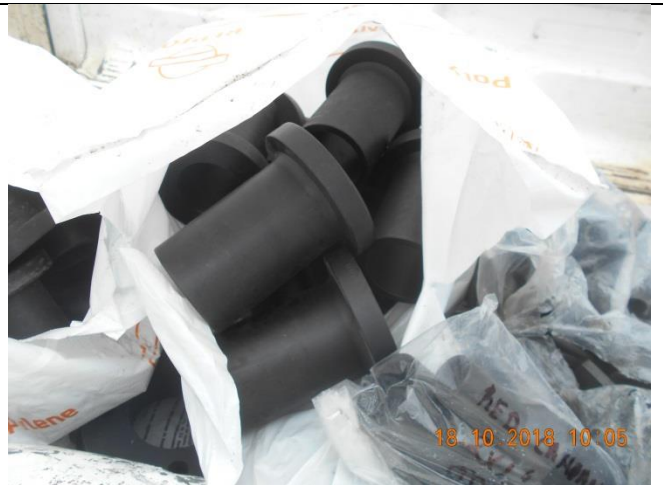
Suministro de conectores