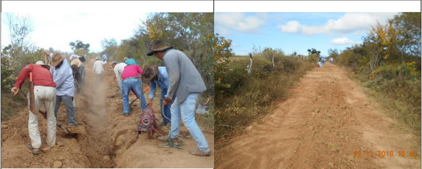
Tapado de zanja para tubería, acción final de la instalación de la línea de conducción en los tres ramales contemplados.