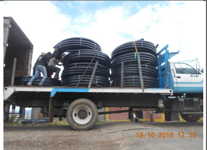
Suministro de tubería de 3" RD 17.