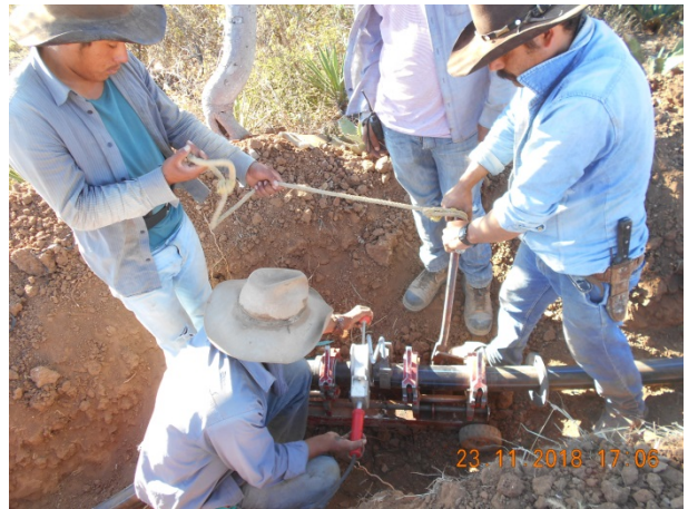
Colocación de piezas especiales