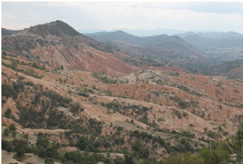
Foto: Vista panorámica al Geoparque

Geosendero “Cerro del Sol” o Nudo Mixteco: (Yucu cui), Cerro de Sol (Yucunchi), ya que estos atractivos turísticos se encuentran alejados de la población, sólo es posible llegar hasta ellos utilizando como medio de transporte las carretas, en las cuales viajan los visitantes y en ellas también se llevan alimentos. En la cima se encuentra un sitio arqueológico. La vista panorámica permite apreciar la magnitud de la erosión. Los suelos han desaparecido y afloran los diversos tipos de rocas.