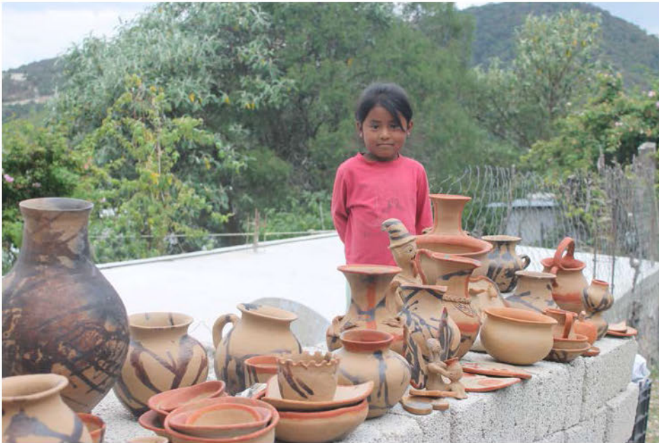
Foto: Artesanías de barro

El 20% de la población elabora artesanías de barro con técnicas propias y tradicionales, solo el 2% ha innovado la técnica para mejora de sus productos y otro 5% elabora artesanías de palma o fibra.