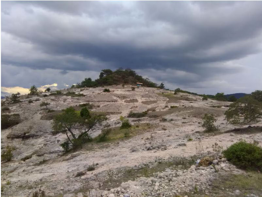
Municipio de Santo Domingo Tonaltepec, Oaxaca