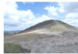
CERRO DEL SOL O "YUCU NCHI" 2650 msnm