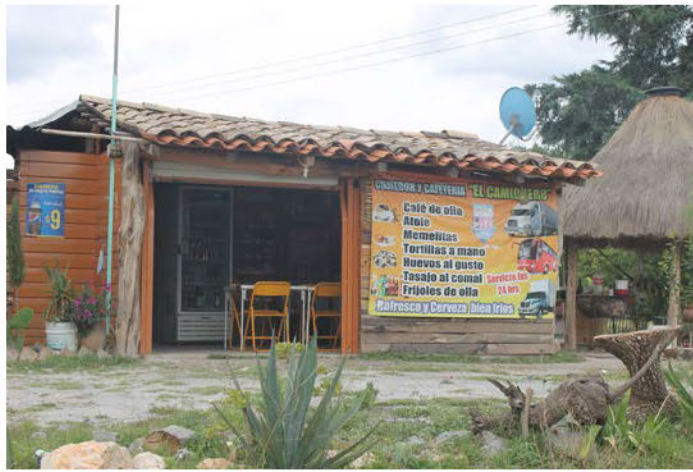
Foto: Comedor y cafetería

Dentro del municipio no se tienen registros de restaurantes, pero hay un comedor – cafetería a orilla de carretera llamado “El camionero”.