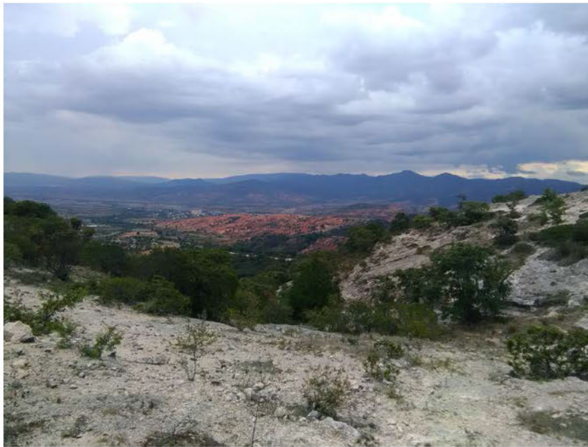
Foto: Panorámica del municipio

De acuerdo a la clasificación climática de Köppen modificada por García (1973), el clima es templado frío (C(wo)w big) tiene un régimen de lluvias en verano, con 5% de lluvias invernales, verano fresco y largo. La temperatura media del mes más caliente es de 22°C encontrándose el mes más caliente entre abril y mayo; la del mes más frío es de 6°C y el mes más frío se encuentra entre noviembre y enero. La precipitación anual para un promedio de 22 años es de 678 mm, con picos máximos en los meses de junio (29%) y septiembre (18%), la evaporación anual media es de 1664 mm.