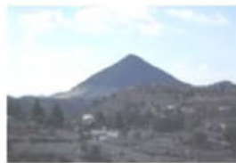
CERRO VERDE O "YUCU CUI"