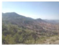
CERRO DE QUINCE O "YUCU DI SHA UN"

El paraje Yodo Hua, Jahayuza, Caguamezcal: lugares en el que su nombre está en Mixteco que va recibiendo el Río Verde, se pueden admirar los pequeños yacimientos de agua que emana y alimenta la vertiente del Río Verde y que todo visitante tiene acceso a este sin ningún costo.