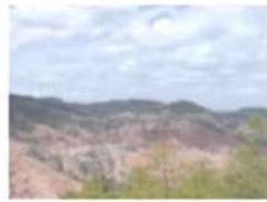
CERRO DE ESCALERA O "YUCU CUALLO"