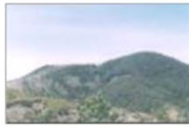
CERRO DE CENIZA O "YUCU NSALLA"