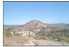
CERRO DE RANA O "YUCU SHAA LELU"