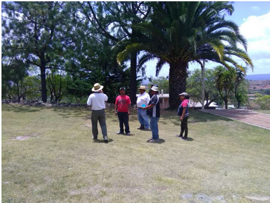
Foto: Recorrido por el municipio

Actitudes y sensibilidades de la población local con respecto al turismo y a los turistas, las personas de la localidad están interesadas en el desarrollo de la actividad turística.