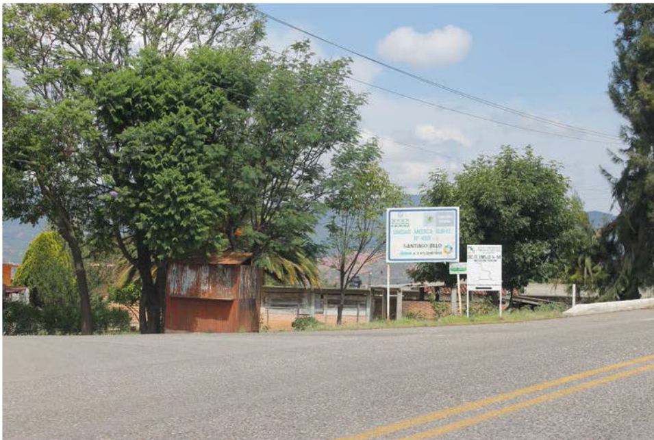
Foto: Entrada al municipio

El municipio se encuentra agrupado al distrito de Nochixtlán, Santiago Tillo se ubica al noroeste de Asunción Nochixtlán que es la ciudad más cercana a la población, a una distancia de 116 kilómetros al noroeste de la capital del estado. A esta última se llega desde la ciudad de Oaxaca por la supercarretera Puebla-Oaxaca 135D y también por la carretera federal 190.