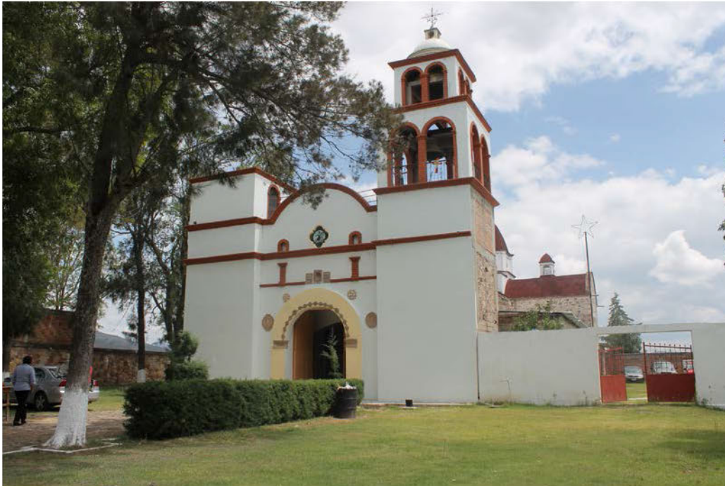
Municipio de Santiago Tillo, Oaxaca