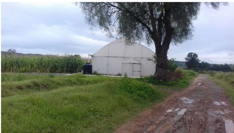
Foto: Tierras de cultivo

La erosión y pérdida de vegetación en los lomeríos se debe al pastoreo extensivo de ganado bovino por parte de algunos productores de la población y principalmente por personas ajenas a la comunidad, esto porque actualmente no existe reglamentación sobre el uso de los terrenos comunales; además no se han implementado obras de recuperación de suelo, programas de reforestación y sistemas de captación de agua.