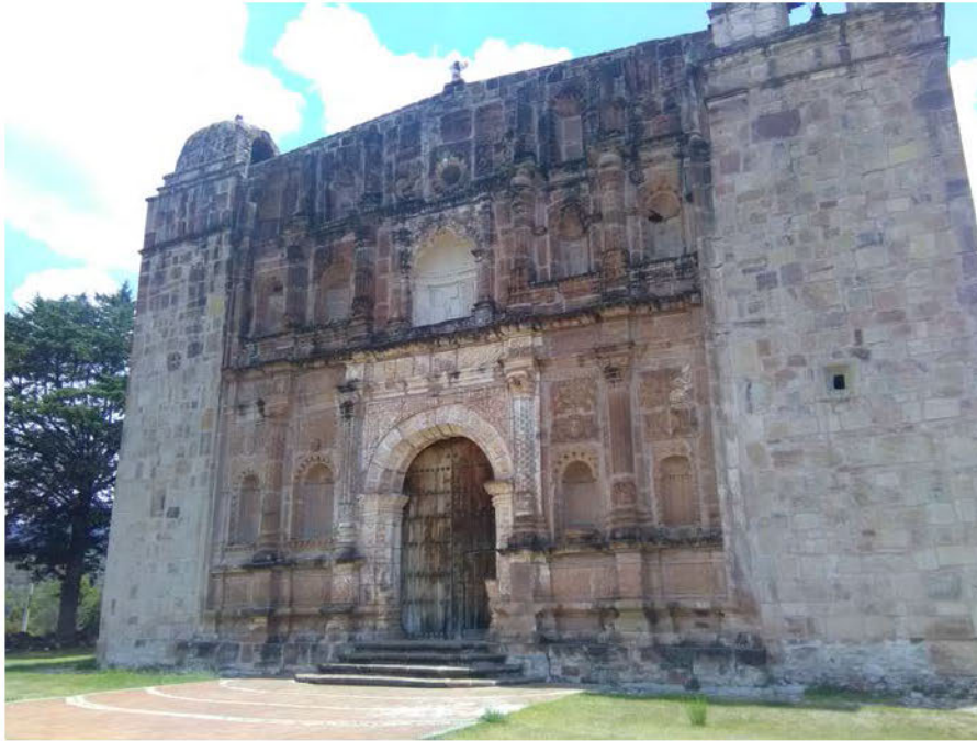
Foto: Templo del siglo XIX