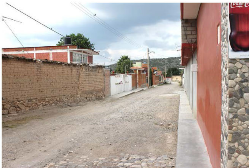
Foto: Viviendas del municipio

Con base a los datos que reporta la encuesta Intercensal 2015, el total de población del municipio de Santa María Chachoápam es de 733 habitantes; población masculina 342 y población femenina 380. Sin embargo, haciendo una suma de estas dos últimas da un total de 722 habitantes, haciendo falta 11 habitantes, esto debido a que, en algunas localidades del mismo municipio, en población femenina y masculina (Faustino Benito Hernández, Río Chiquito, Camino a Yucuita y Santa Ana) hubo muestra insuficiente para el cálculo del indicador respectivo y valores reservados por confidencialidad, según la encuesta Intercensal, 2015.