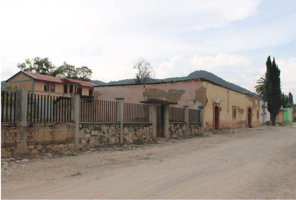
Foto: Viviendas en el municipio

Se estima que en la población aún no está cubierto al 100 por ciento con los servicios básicos; así como la infraestructura suficiente y de calidad para brindar un mejor servicio que satisfaga las necesidades de los habitantes de Santa María Chachoápam.