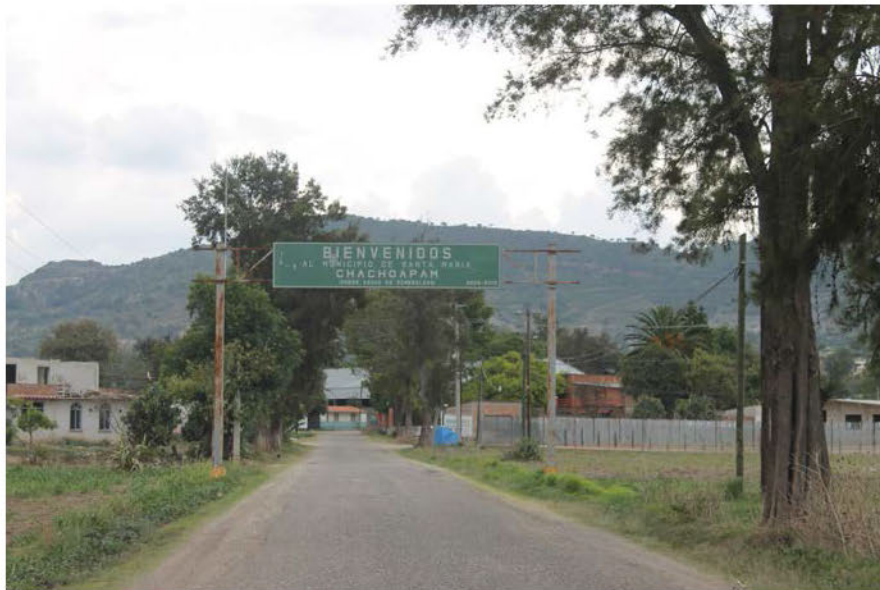
Foto: Entrada al municipio

El acceso del Municipio de Santa María Chachoápam, es sobre la carretera federal 190 Oaxaca-Huajuapán, en el kilómetro 181 tomar la salida a la localidad de Yucuita, y seguir la carretera pavimentada hasta el municipio (8.5 km).