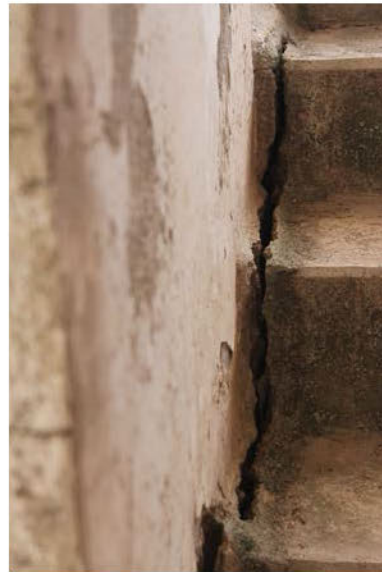
Foto: Grietas en escaleras del templo

En cuanto a los atractivos culturales se tiene el templo cuya construcción data del siglo XVI, presenta afectaciones originadas por los sismos de septiembre de 2017.