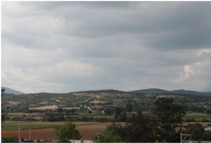
Foto: Panorámica del municipio

Los climas presentes en el municipio son: el templado subhúmedo con lluvias en verano, (menos húmedo) y templado subhúmedo con lluvias en verano (de humedad media), el primero abarca la mayor parte del territorio, presenta una temperatura media anual entre 14°C y 18°C, la temperatura del mes más frío es entre -3°C y 18°C y del mes más caliente bajo 22°C. En este tipo de clima presenta lluvias en verano y porcentaje de lluvia invernal mayor al 10% del total anual. El templado subhúmedo es el menos seco de los secos, presenta lluvias en verano manifestándose en los meses de julio y agosto. Su precipitación total anual es alrededor de 600 a 800 mm, con lluvia invernal inferior al 5%.