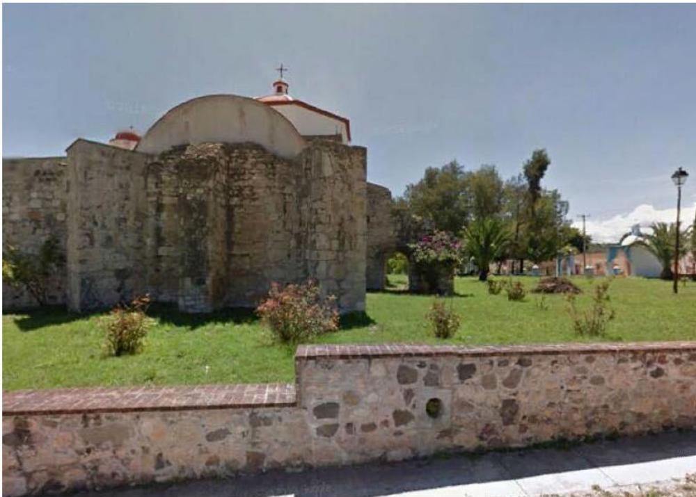
Municipio de Santa María Chachoápam, Oaxaca