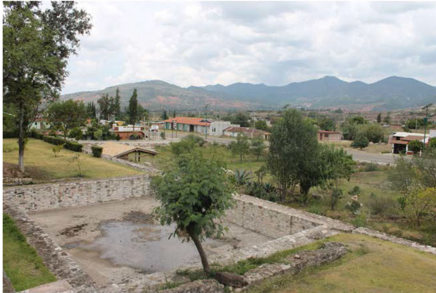
Foto: Panorámica desde el conjunto conventual

marcado por un fuerte periodo de sequía con aumento de temperatura, este fenómeno ocasiona problemas en los cultivos por aumento en la incidencia de plagas y enfermedades y falta de agua.