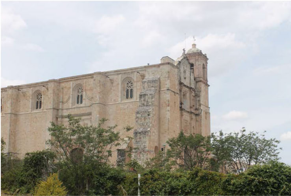
Foto: Iglesia y ex convento de Santo Domingo

Casa del cacique: El Comisariado de Bienes comunales se encuentra a cargo de lugar el cual requiere estudios y restauración.