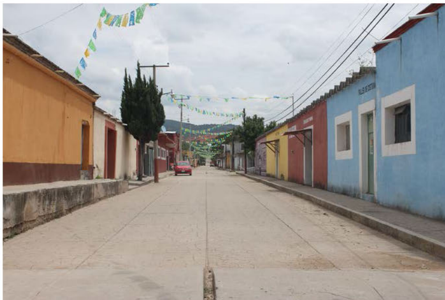
Foto: Viviendas del municipio

De acuerdo al Instituto Nacional de Estadística y Geografía (Censo de Población y Vivienda 2010), en el municipio existe un total de viviendas habitadas de 455, de las cuales 432 disponen de excusado o sanitario, 204 disponen de drenaje, 422 disponen de agua entubada de la red pública y 429 disponen de energía eléctrica.