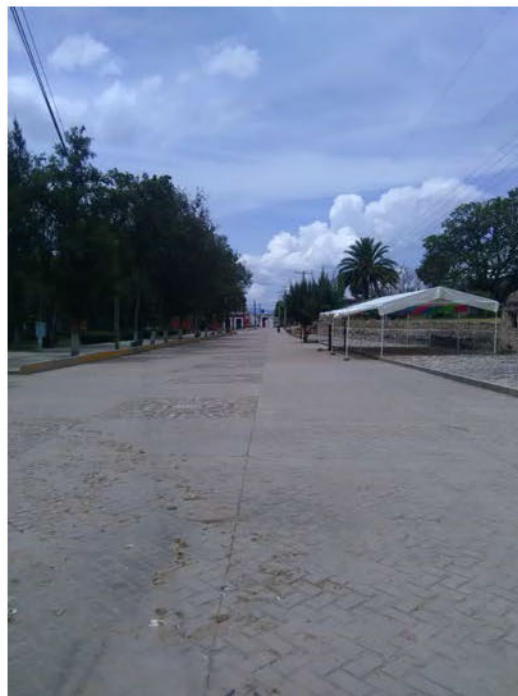
Foto: Calle del municipio

No existe ninguna línea de transporte en el municipio, aunque existen 15 vehículos particulares de carga con capacidad mayor a 3 toneladas, además del parque vehicular particular con vehículos tipo pick up, garantizan el transporte el interior del municipio.