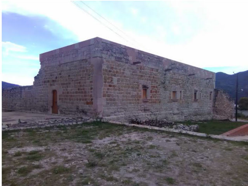
Foto: Conjunto conventual

Dentro de los trabajos que se realizaron estuvo el fortalecimiento y completa restauración de la cubierta del templo, la reconstrucción del complejo conventual de la cual sólo quedaban algunos muros y cubiertas, así como la barda perimetral del atrio y las cuatro capillas posas en sus esquinas.