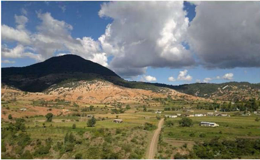
Foto: Tipo de orografía