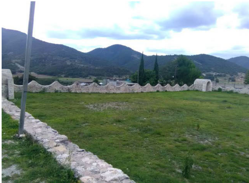
Foto: Atrio de la iglesia