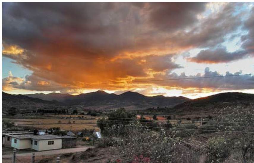
Foto: Panorámica San Juan Teposcolula

Del total de viviendas habitadas en el municipio se tiene que el 71.93% cuenta con radio, el 67.11% con televisión, el 33.16% con refrigerador, el 20.59% con lavadora, el 15.24% con teléfono fijo, el 22.19% con automóvil, el 3.74% con computadora, el 16.31% con teléfono celular y el 0.53% con internet.