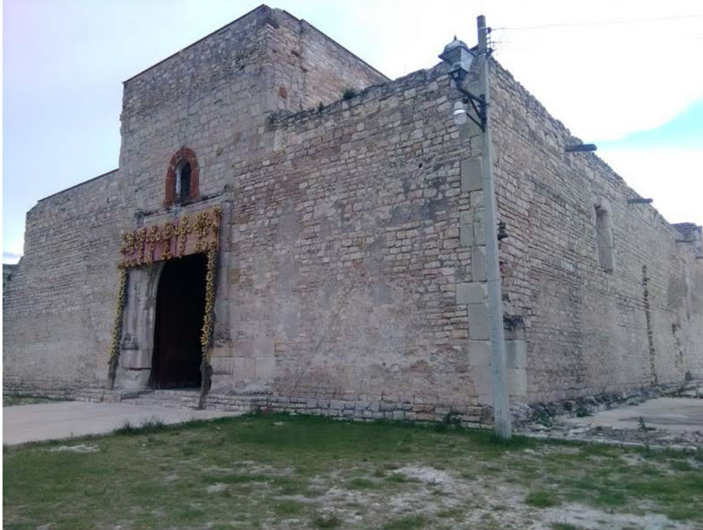
Foto: Templo religioso

encuentran campanarios a los costados del frente como era una costumbre, estos se encuentran en su ábside, dándole una imagen única a este templo.