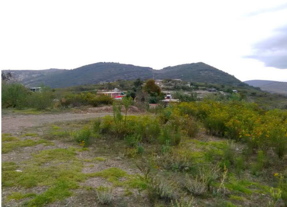
Foto: Paisaje natural del municipio