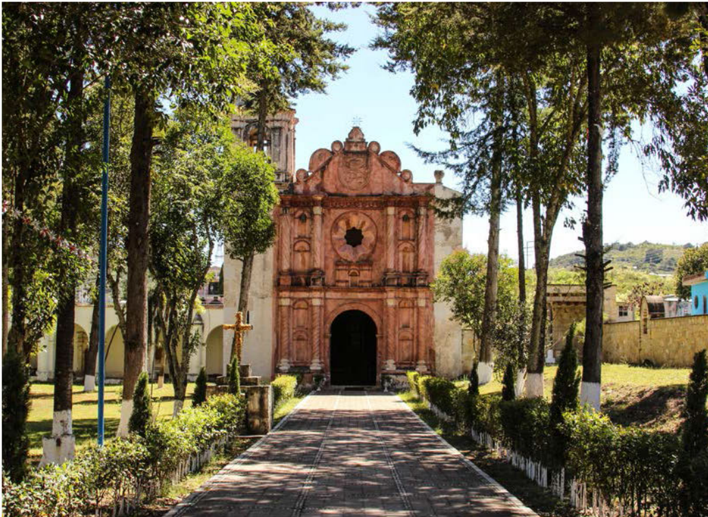
Municipio de San Bartolo Soyaltepec, Oaxaca