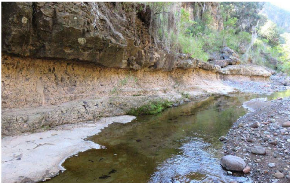
Foto: Riachuelo en Geosendero Yutoto

Geosendero "Yutoto" : Permite apreciar la diversidad geológica en las unidades litológicas más antiguas del territorio que comprende el Geoparque, como son cavernas, fósiles, terra rossa y campos de lenar, entre otros.