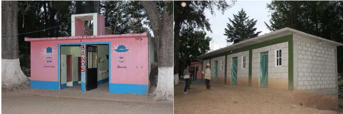
Foto: Baños públicos y cuartos