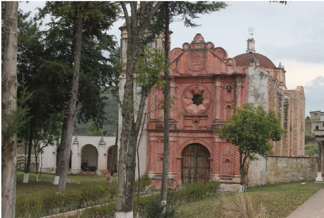
Foto: Templo de San Bartolomé

Iglesia San Bartolomé : Este templo católico data del año de 1723; consta de una sola nave y un edificio que funge como sacristía. Su estilo corresponde a la arquitectura barroca, caracterizada por el predominio de líneas curvas y una exuberante decoración, en la que se integran pinturas y esculturas.