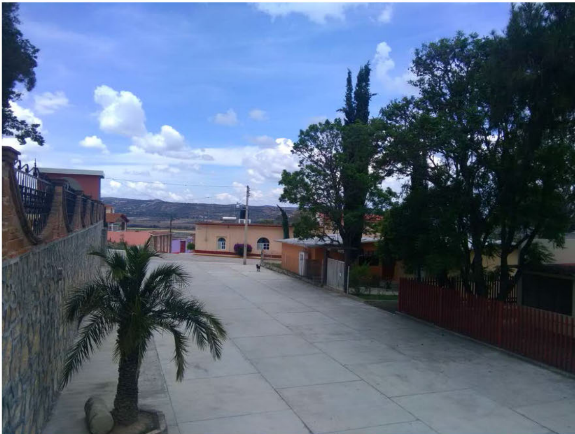
Foto: Calles del municipio

Lo cual nos dice que podríamos tener una excelente captación de agua de lluvia por medio de bordos de retención de agua, situación que el comisariado de bienes comunales realiza en colaboración con el programa PROARBOL.