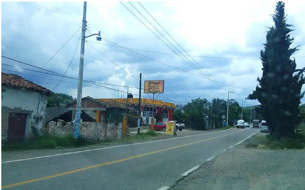
Foto: comedor a orilla de carretera

Los restaurantes que ofrecen servicios se enfocan a los habitantes o personas cercanas que llegan a la localidad. Se cuenta con información sobre un restaurante llamado “San Andrés”, ubicado a orilla de la carretera.