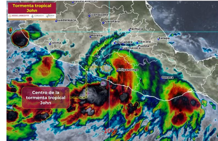
Imagen de satélite