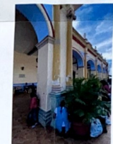
F-03 Vista exterior de la fachada Norte, desprendimiento de pintura. Bóveda catinada a base de ladrillo de barro rojo recocido.