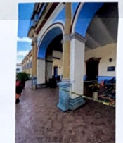
F-04 Vista exterior de la fachada Norte.