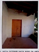
F-01. VISTA EXTERIOR HACIA RUINA EN ANEXO. SE OBSERVA PRESENCIA DE DAÑOS A CAUSA DE SISMO.