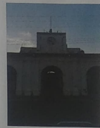
F-01. VISTA HACIA ACCESO ALZADO ORIENTE CON PRESENCIA DE GRIETAS Y DESPINDIMIENTO DE APLANADOS A CAUSA DE SISMO.