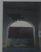
F-03. VISTA HACIA ARCO DE TABIQUE ROJO FRACTURADO CON DESPINDIMIENTO DE PIEZAS A CAUSA DE SISMO.