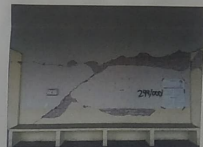
F-02. VISTA HACIA MURO DE TABIQUE ROJO CON DESPINDIMIENTO DE APLANADOS Y PIEZAS FRACTURADAS A CAUSA DE SISMO.