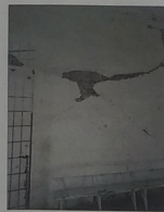
F-04. VISTA HACIA MURO DE TABIQUE ROJO CON DESPINDIMIENTO DE APLANADOS Y PIEZAS FRACTURADAS A CAUSA DE SISMO.