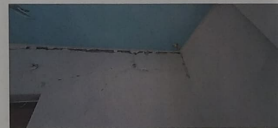
VISTA INTERIOR DE HABITACIONES CON PRESENCIA DE GRIETAS Y PERDIDA PARCIAL DE APLANADOS.