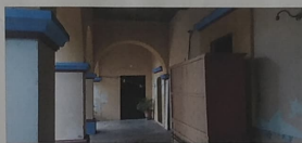
VISTA INTERIOR DEL PASILLO, DONDE SE DENOTAN LAS COLUMNAS DE TABIQUE DE BARRO ASÍ COMO LA LOSA DE CONCRETO ARMADO