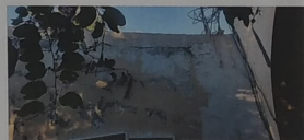
VISTA EXTERIOR DE MUROS, CON PRESENCIA DE GRIETAS, A CAUSA DE SISMOS Y DESPRENDIMIENTO PARCIAL DE APLANADOS.