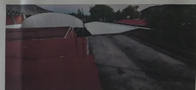
VISTA EXTERIOR DE CUBIERTA DE BOVEDA CATALANA, CON DESPRENDIMIENTO DE ENTORTADOS Y PRESENCIA DE GRIETAS.