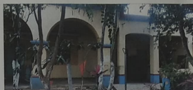
VISTA EXTERIOR DEL PASILLO, DONDE SE DENOTAN LAS COLUMNAS DE TABIQUE DE BARRO QUE FLANQUEAN LAS HABITACIONES.