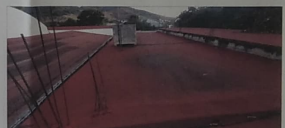
VISTA EXTERIOR DE LOSAS CON IMPERMEABILIZANTE A BASE DE CARTÓN ASFÁLTICO LOS CUALES CUENTAN CON PRESENCIA DE HUMEDAD Y DESPRENDIMIENTO DLE MISMO MATERIAL.