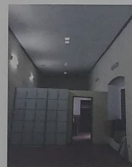
F-07 Vista interior de la oficina 1; muros con un espesor promedio de 83cm, aplomados de mortero, acabado fino y pintura vinílica en paramentos interiores, piso con loseta cerámica y plafones en techo interior de techo.