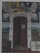
F-10 Vista exterior del salón de representantes; paramentos exteriores con presencia de muretas, piso con loseta cerámica.