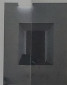
F-08 Vista interior de la oficina 2; presencia de grietas en el interruptor de la ventanera.