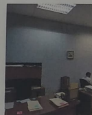
F-09 Vista interior de la oficina 3; muros con un espesor promedio de 83cm, aplomados de mortero, acabado fino y pintura vinílica en paramentos interiores, piso con loseta cerámica y plafones en techo interior de techo.