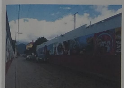
F-11 Vista exterior del paramento norte; continuación de grietas en sentido horizontal al muro, hoy presencia de humedad, lo que está provocando el desmenujamiento de aplomados y cayo de pintura.