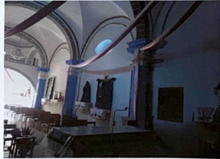
F-01 VISTA GENERAL HACIA LATERAL NORTE POR EL INTERIOR DE LA NAVE.