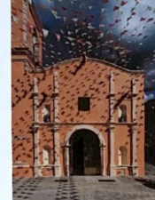
F-01 VISTA GENERAL FACHADA PONENTE, ACCESORIAL, FACHADA A BASE DE 2 CUERPOS, Y UN REHATE EN ARCO. SE APPRECA TAMBIEN EL UNICO CAMPANARIO.