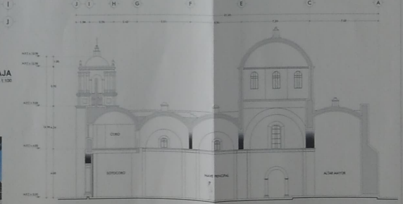
SECCIÓN LONGITUDINAL B-B' ESCALA 1:100