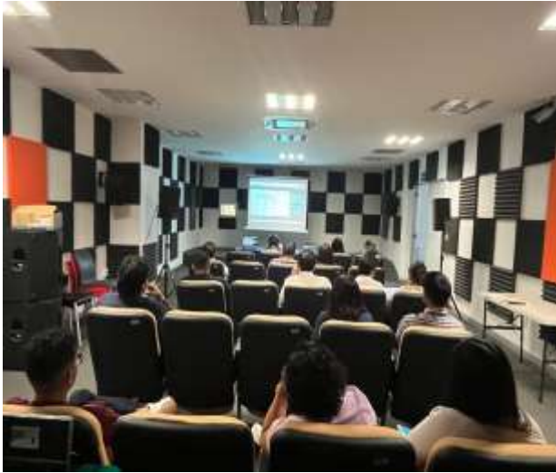
FOTOGRAFÍA 5. CÓDIGO DE ÉTICA PARA LAS PERSONAS SERVIDORAS PÚBLICAS DE LA ADMINISTRACIÓN PÚBLICA ESTATAL.

"2026, Año del Bicentenario del Natalicio de Margarita Maza Parada, ejemplo de dignidad, lealtad y servicio a la Nación"