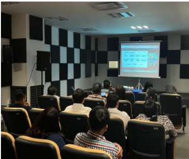
FOTOGRAFÍA 3. CÓDIGO DE ÉTICA PARA LAS PERSONAS SERVIDORAS PÚBLICAS DE LA ADMINISTRACIÓN PÚBLICA ESTATAL.