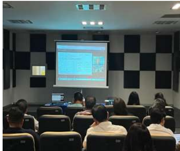
FOTOGRAFÍA 6. CÓDIGO DE ÉTICA PARA LAS PERSONAS SERVIDORAS PÚBLICAS DE LA ADMINISTRACIÓN PÚBLICA ESTATAL.