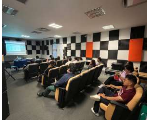
FOTOGRAFÍA 2. CÓDIGO DE ÉTICA PARA LAS PERSONAS SERVIDORAS PÚBLICAS DE LA ADMINISTRACIÓN PÚBLICA ESTATAL.