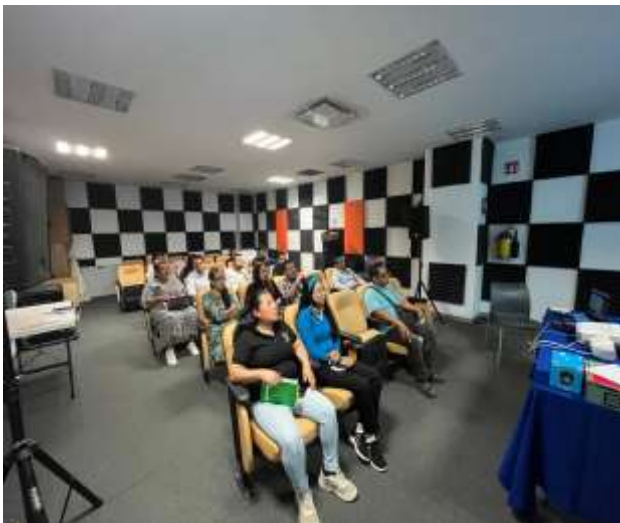
FOTOGRAFÍA 7. CÓDIGO DE ÉTICA PARA LAS PERSONAS SERVIDORAS PÚBLICAS DE LA ADMINISTRACIÓN PÚBLICA ESTATAL.