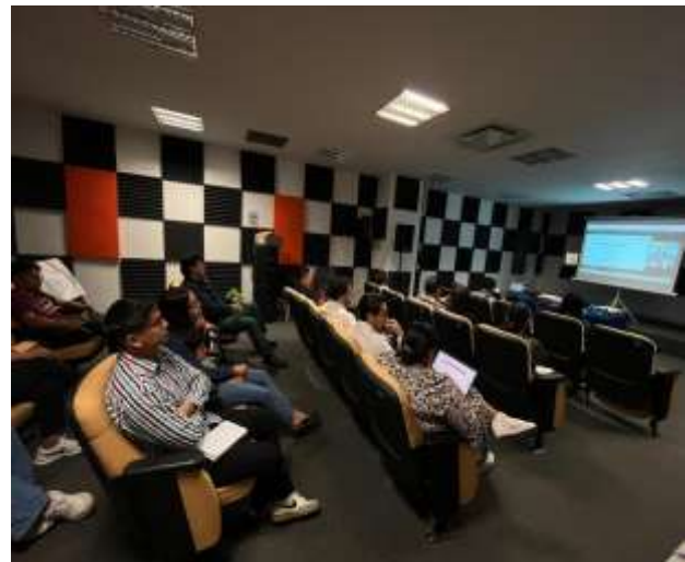
FOTOGRAFÍA 4. CÓDIGO DE ÉTICA PARA LAS PERSONAS SERVIDORAS PÚBLICAS DE LA ADMINISTRACIÓN PÚBLICA ESTATAL.