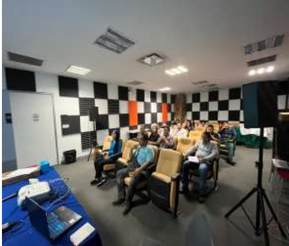
FOTOGRAFÍA 1. CÓDIGO DE ÉTICA PARA LAS PERSONAS SERVIDORAS PÚBLICAS DE LA ADMINISTRACIÓN PÚBLICA ESTATAL.

"2026, Año del Bicentenario del Natalicio de Margarita Maza Parada, ejemplo de dignidad, lealtad y servicio a la Nación"