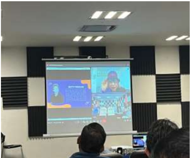
FOTOGRAFÍA 7. CÓDIGO DE ÉTICA PARA LAS PERSONAS SERVIDORAS PÚBLICAS DE LA ADMINISTRACIÓN PÚBLICA ESTATAL CON ENFOQUE DE PERSPECTIVA DE GÉNERO.