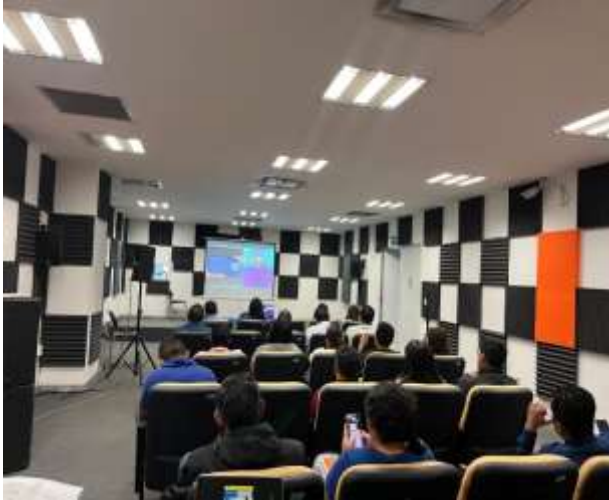
FOTOGRAFÍA 5. CÓDIGO DE ÉTICA PARA LAS PERSONAS SERVIDORAS PÚBLICAS DE LA ADMINISTRACIÓN PÚBLICA ESTATAL CON ENFOQUE DE PERSPECTIVA DE GÉNERO.

"2026, Año del Bicentenario del Natalicio de Margarita Maza Parada, ejemplo de dignidad, lealtad y servicio a la Nación"