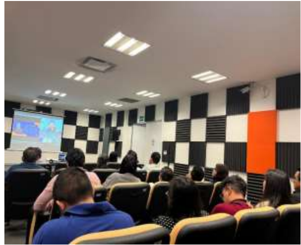
FOTOGRAFÍA 6. CÓDIGO DE ÉTICA PARA LAS PERSONAS SERVIDORAS PÚBLICAS DE LA ADMINISTRACIÓN PÚBLICA ESTATAL CON ENFOQUE DE PERSPECTIVA DE GÉNERO.