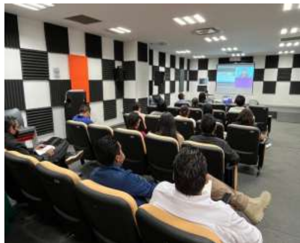
FOTOGRAFÍA 4. CÓDIGO DE ÉTICA PARA LAS PERSONAS SERVIDORAS PÚBLICAS DE LA ADMINISTRACIÓN PÚBLICA ESTATAL CON ENFOQUE DE PERSPECTIVA DE GÉNERO.