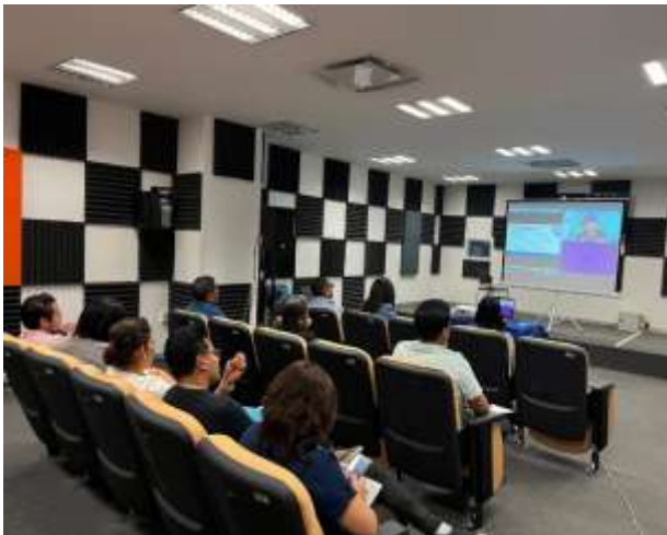
FOTOGRAFÍA 3. CÓDIGO DE ÉTICA PARA LAS PERSONAS SERVIDORAS PÚBLICAS DE LA ADMINISTRACIÓN PÚBLICA ESTATAL CON ENFOQUE DE PERSPECTIVA DE GÉNERO.