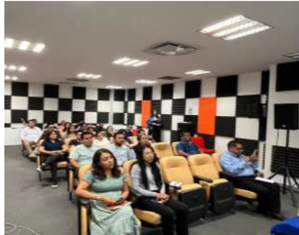
FOTOGRAFÍA 2. CÓDIGO DE ÉTICA PARA LAS PERSONAS SERVIDORAS PÚBLICAS DE LA ADMINISTRACIÓN PÚBLICA ESTATAL CON ENFOQUE DE PERSPECTIVA DE GÉNERO.