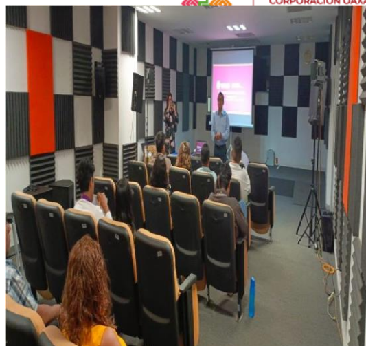
Fotografía 6. Capacitación de funciones del Comité de Ética y de Prevención de Conflictos de Interés.