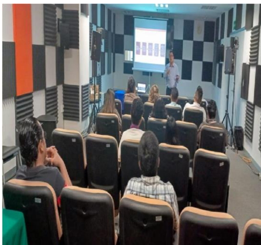
Fotografía 1. Capacitación de funciones del Comité de Ética y de Prevención de Conflictos de Interés.