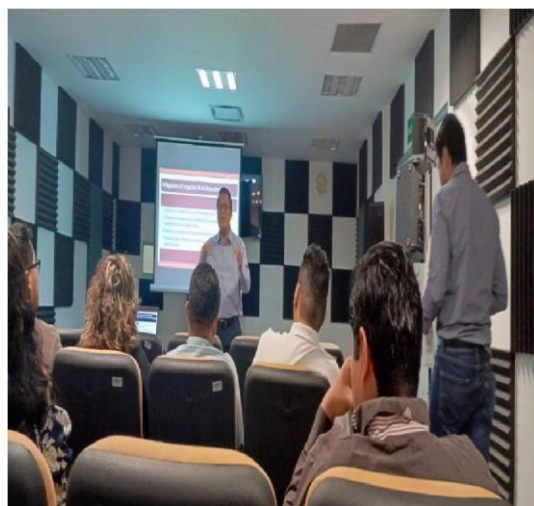
Fotografía 7. Capacitación de funciones del Comité de Ética y de prevención de conflictos de interés.