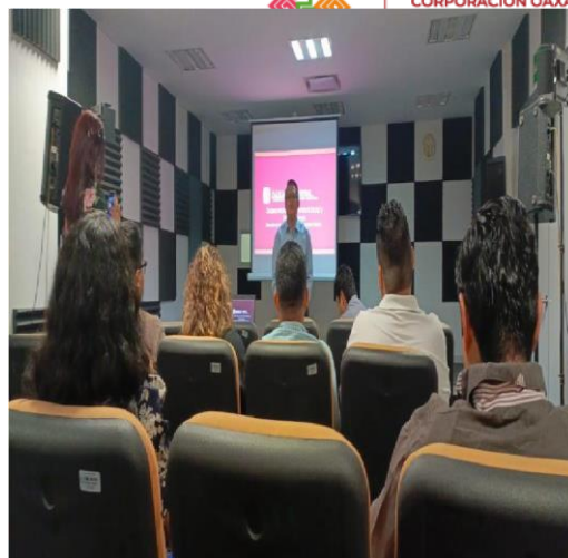
Fotografía 2. Capacitación de funciones del Comité de Ética y de Prevención de Conflictos de Interés.