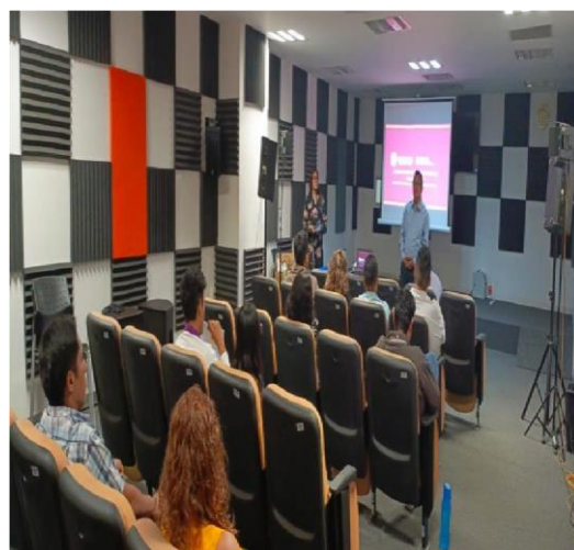
Fotografía 4. Capacitación de funciones del Comité de Ética y de Prevención de Conflictos de Interés.