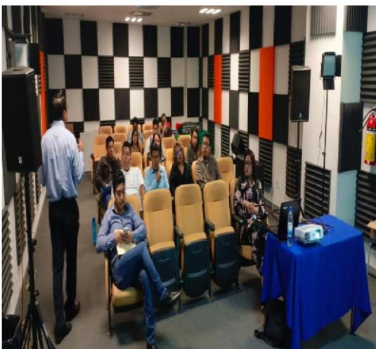
Fotografía 3. Capacitación de funciones del Comité de Ética y de Prevención de Conflictos de Interés.