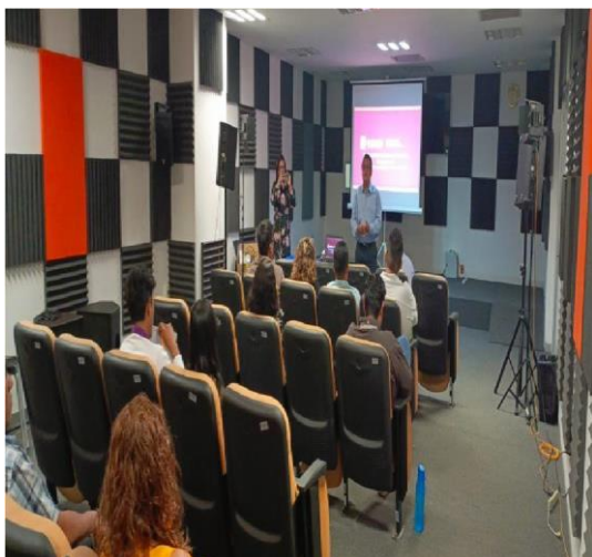
Fotografía 5. Capacitación de funciones del Comité de Ética y de Prevención de Conflictos de Interés.