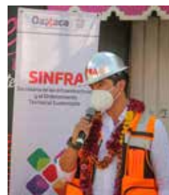
A la fecha se han concluido