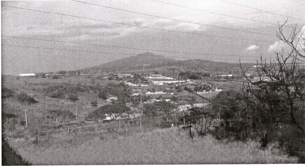
Recorrido por los terrenos e instalaciones destinadas para la Institución Educativa de Nivel Superior.