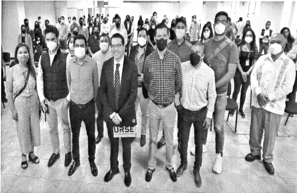
FOTOGRAFÍA AL TÉRMINO DE LA EXPOSICIÓN DE LA OFERTA EDUCATIVA PROPORCIONADA POR: INSTITUTO TECNOLÓGICO DEL VALLE DE ETLA (ITVE), UNIVERSIDAD REGIONAL DEL SURESTE (URSE), POLIVIRTUAL DEL INSTITUTO TECNOLÓGICO NACIONAL (IPN) Y CENTRO DE EDUCACIÓN CONTINUA ABIERTA Y A DISTANCIA CECAD-UABJO.