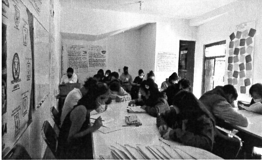
SUPERVISIÓN Y VIGILANCIA DE CENTROS DE ASESORÍA DE PREPARATORIA ABIERTA DE SANTA CATARINA, JUQUILA, OAX.