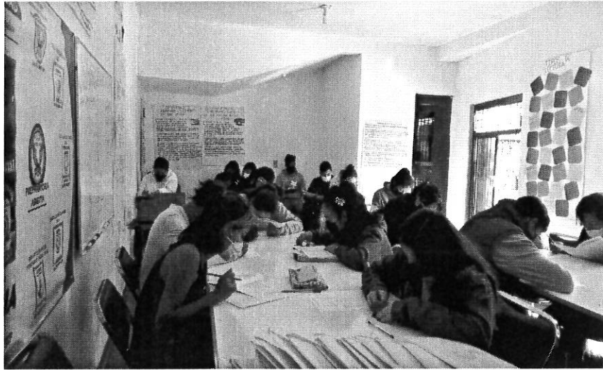
SUPERVISIÓN Y VIGILANCIA DE CENTROS DE ASESORÍA DE PREPARATORIA ABIERTA DE SANTA CATARINA, JUQUILA, OAX.