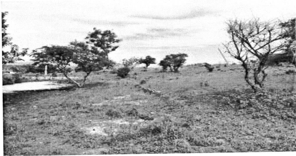
Recorrido por los terrenos donde se pretende construir la Universidad Politécnica de nueva creación en Matías Romero, Oax.