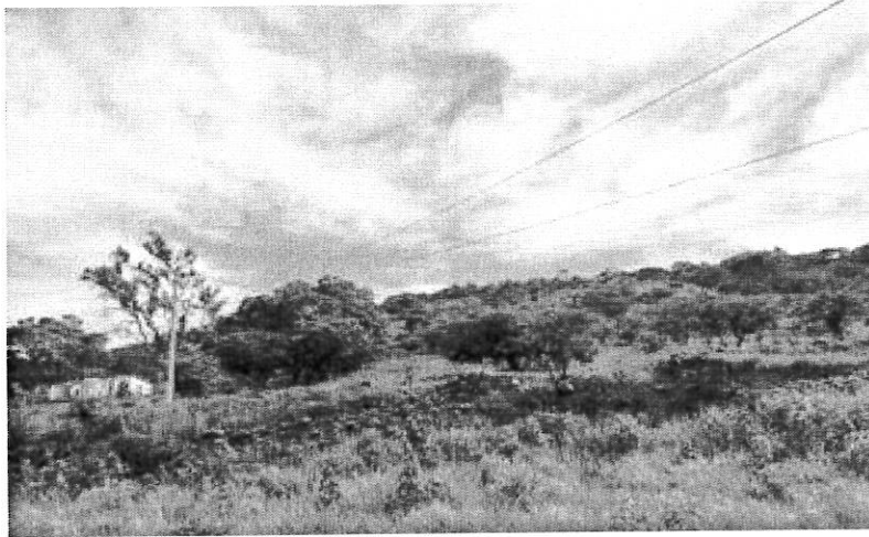
Recorrido por los terrenos donde se pretende construir la Universidad Politécnica de nueva creación en Matías Romero, Oax.