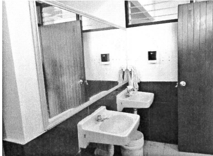
INSPECCIÓN TÉCNICA, HIGIÉNICA Y PEDAGÓGICA A INSTITUCIONES PARTICULARES DE EDUCACIÓN MEDIA SUPERIOR Y SUPERIOR, CON REVOE Y EN TRÁMITE DE REVOE)