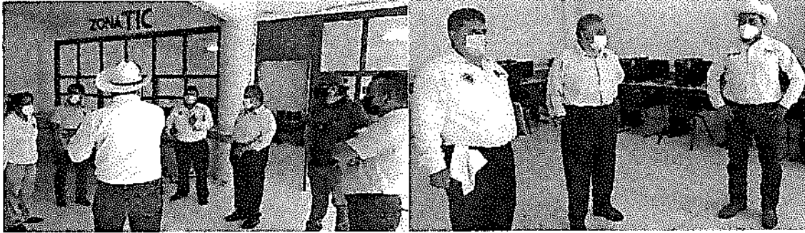
RECORRIDO POR LAS INSTALACIONES DE LA ZONA TIC, CENTRO DE COMPUTO MUNICIPAL