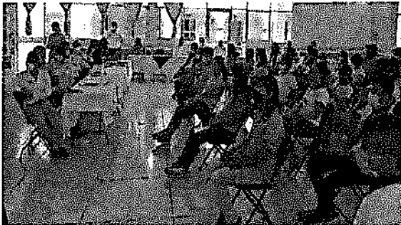
REUNIÓN CON H. AYUNTAMIENTO DE SANTA MARÍA COLOTEPEC Y LOS JÓVENES DEL COBAO PLANTEL 36