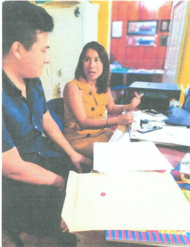
Ilustración 16 Coordinación de licenciaturas

A handwritten signature in black ink, consisting of several loops and a long horizontal stroke.