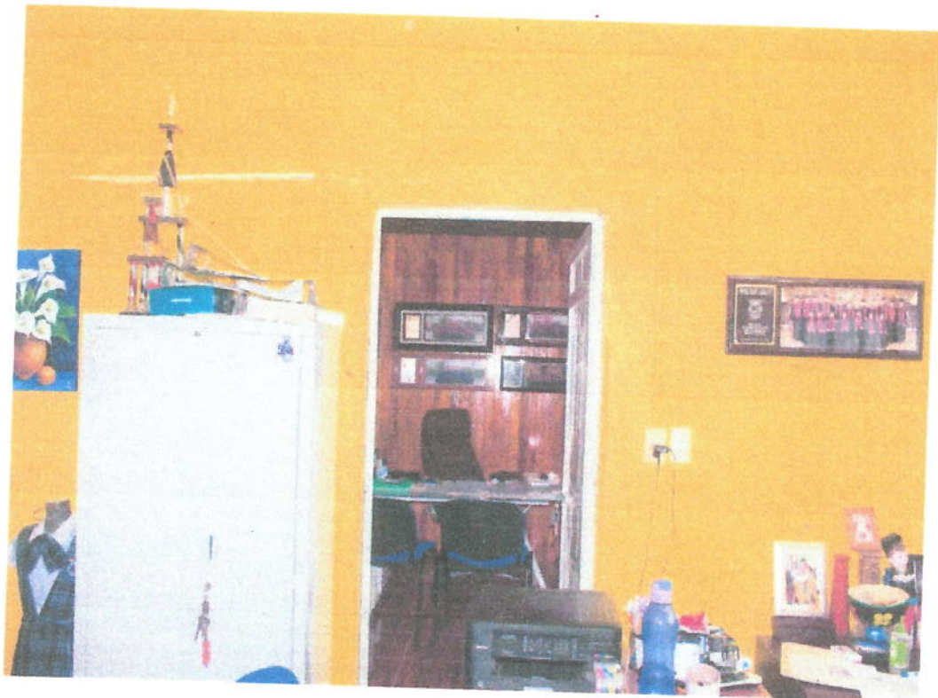
Ilustración 6 Coordinación de licenciaturas