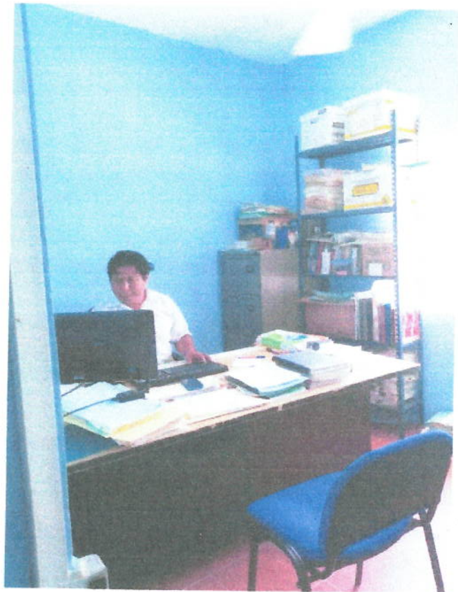
Ilustración 6 Control escolar