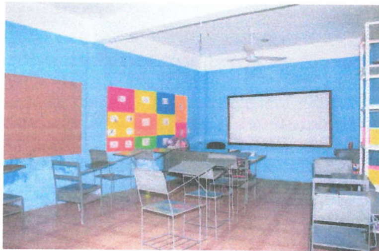
Ilustración 2 Aula 202