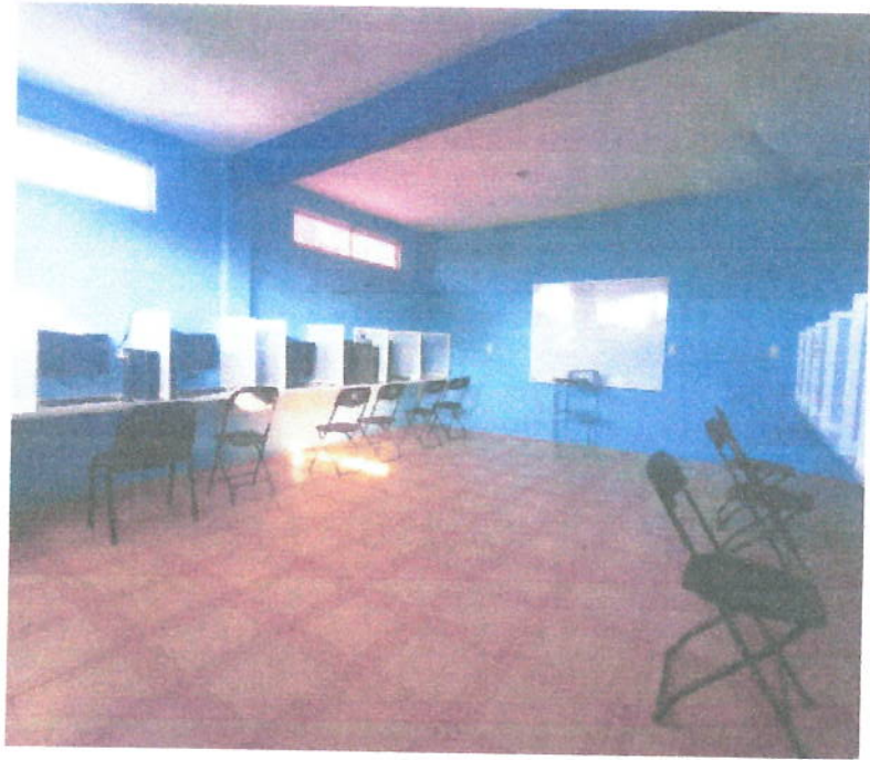
Ilustración 5 Centro de cómputo