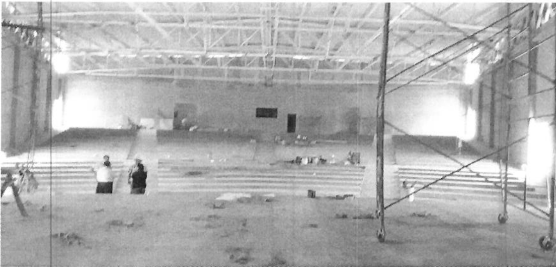
AUDITORIO DE LA UNIVERSIDAD DE LA SIERRA SUR