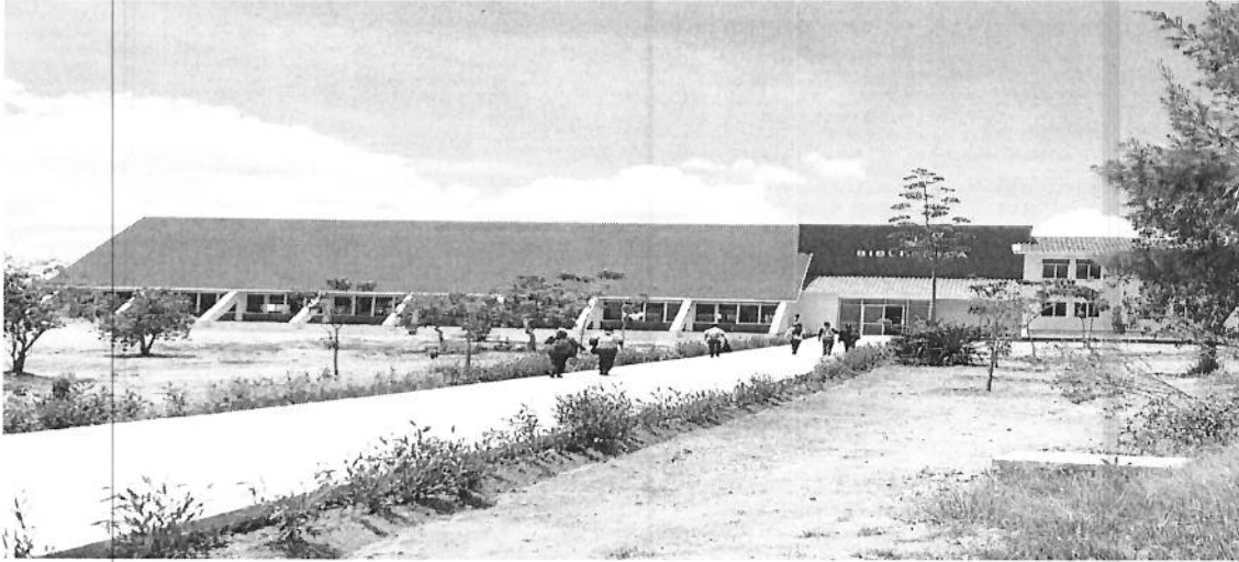
EDIFICIO DE LA NUEVA BIBLIOTECA DE LA UNIVERSIDAD DE LA SIERRA SUR