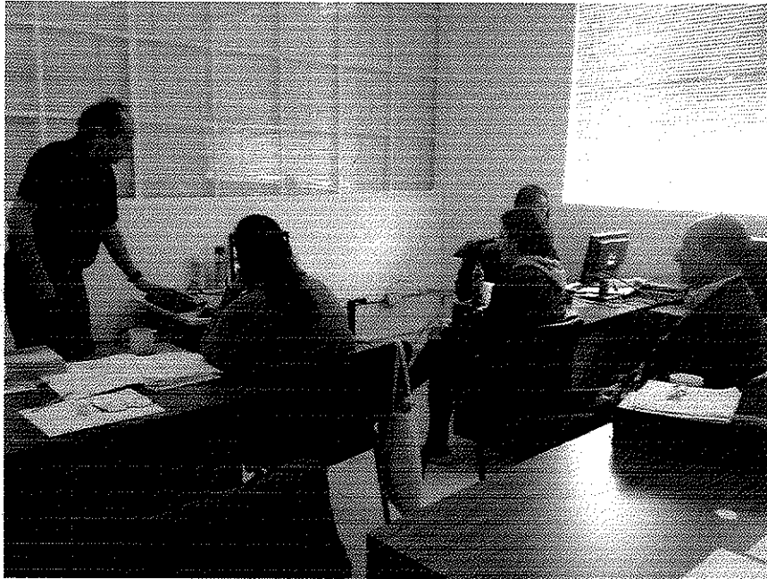
Capacitación de la implementación del Plan Modular (etapa teórica)