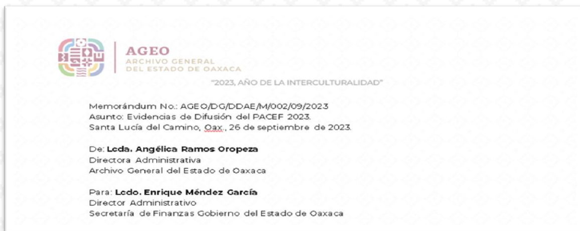
Imagen 4. Encabezado memorándum