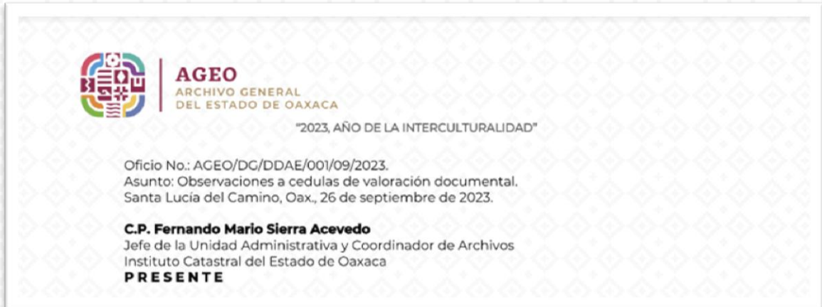
Imagen 2. Encabezado y cadena

La clave de identificación del documento deberá ir en mayúsculas y alineado a la izquierda y estará compuesta por la palabra que indica el tipo de documento (oficio, memorándum o circular), las iniciales o siglas de la Dependencia o Entidad emisora, así como las siglas de la Unidad Administrativa y/o del área que elabora el documento en el caso de oficios, (sin considerar preposiciones ni conjunciones); el número consecutivo de emisión a tres o cuatro posiciones, y los cuatro dígitos del año en que se emite.