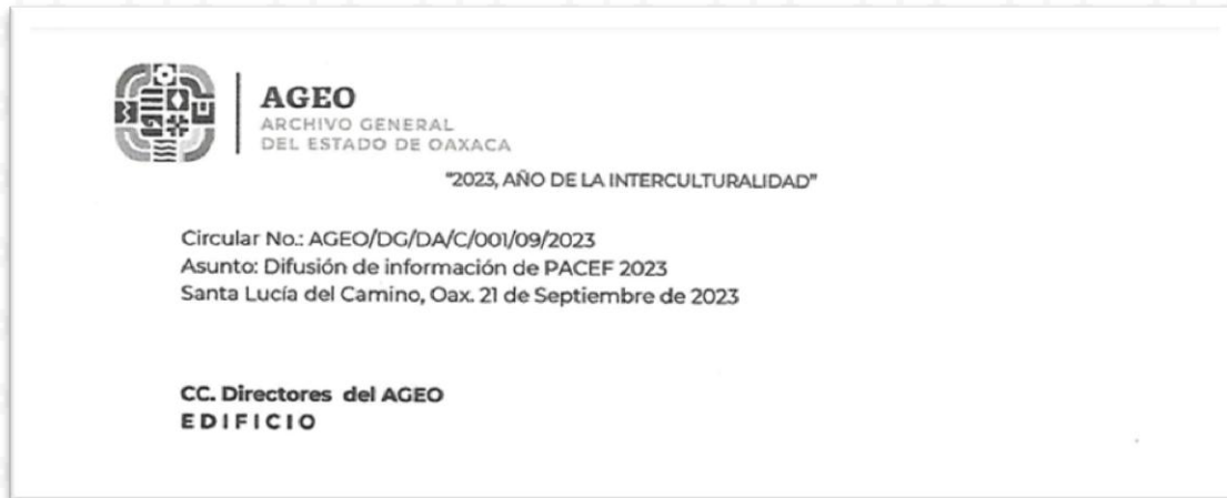
Imagen 5. Encabezado circular

Cuando una circular sea emitida conjuntamente por dos Dependencias o Entidades, se deberá mencionar el nombre de ambas instancias, y la clave será conformada con las iniciales de las mismas, separando cada dependencia con un guión. El número que se asigne será el consecutivo que lleve la dependencia o entidad que aparezca en primer término.