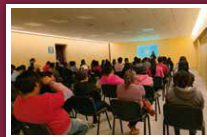
Refuerza Administración acciones de prevención del VIH con capacitación sobre el PEP y PrEP