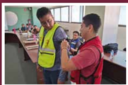
Administración capacita a funcionariado en primeros auxilios y gestión de emergencias