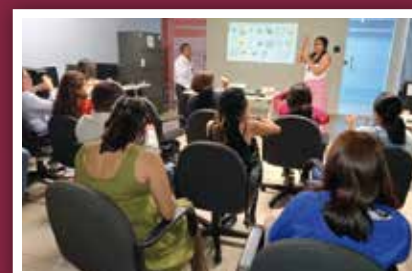
Capacitan a funcionario de la Secretaría de Administración en LSM