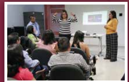
Capacita SA en lengua de señas mexicanas para garantizar la atención inclusiva