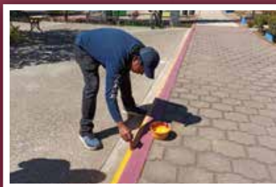
Realiza Secretaría de Administración embellecimiento en espacios públicos