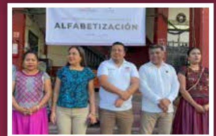
Realiza Secretaría de Administración Mega Tequio de Alfabetización en San Blas Atempa