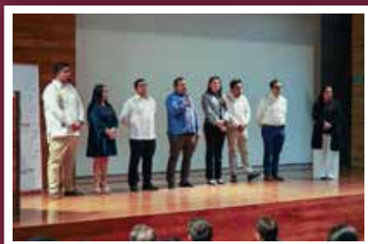
Capacitación sobre la ejecución de recursos fortalece la transparencia en Oaxaca