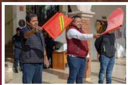
Administración encabeza mega tequio de alfabetización en San Pablo Etla