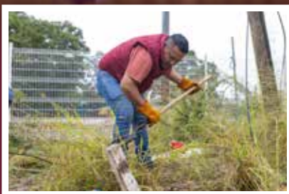
Participa Secretaría de Administración en tequio bienestar de espacio público