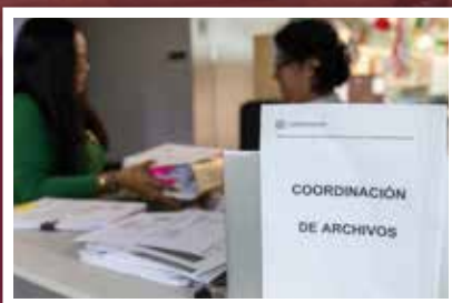
Avanza la baja documental conforme a los lineamientos del AGEO