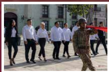
Trabajadores del estado de Oaxaca rinden honores al lábaro patrio