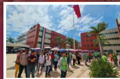
Participa Secretaría de Administración en simulacro del 19-S