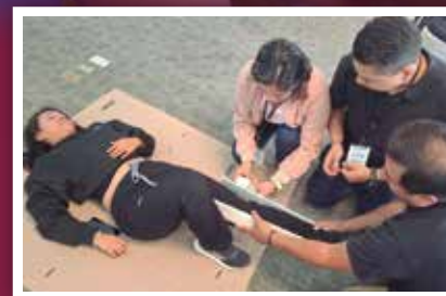
Personal de ciudad administrativa se capacita en materia de protección civil