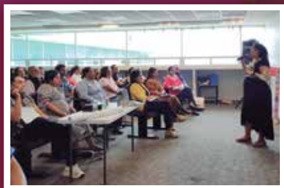
Capacitan a funcionarios estatales para prevenir violencia digital