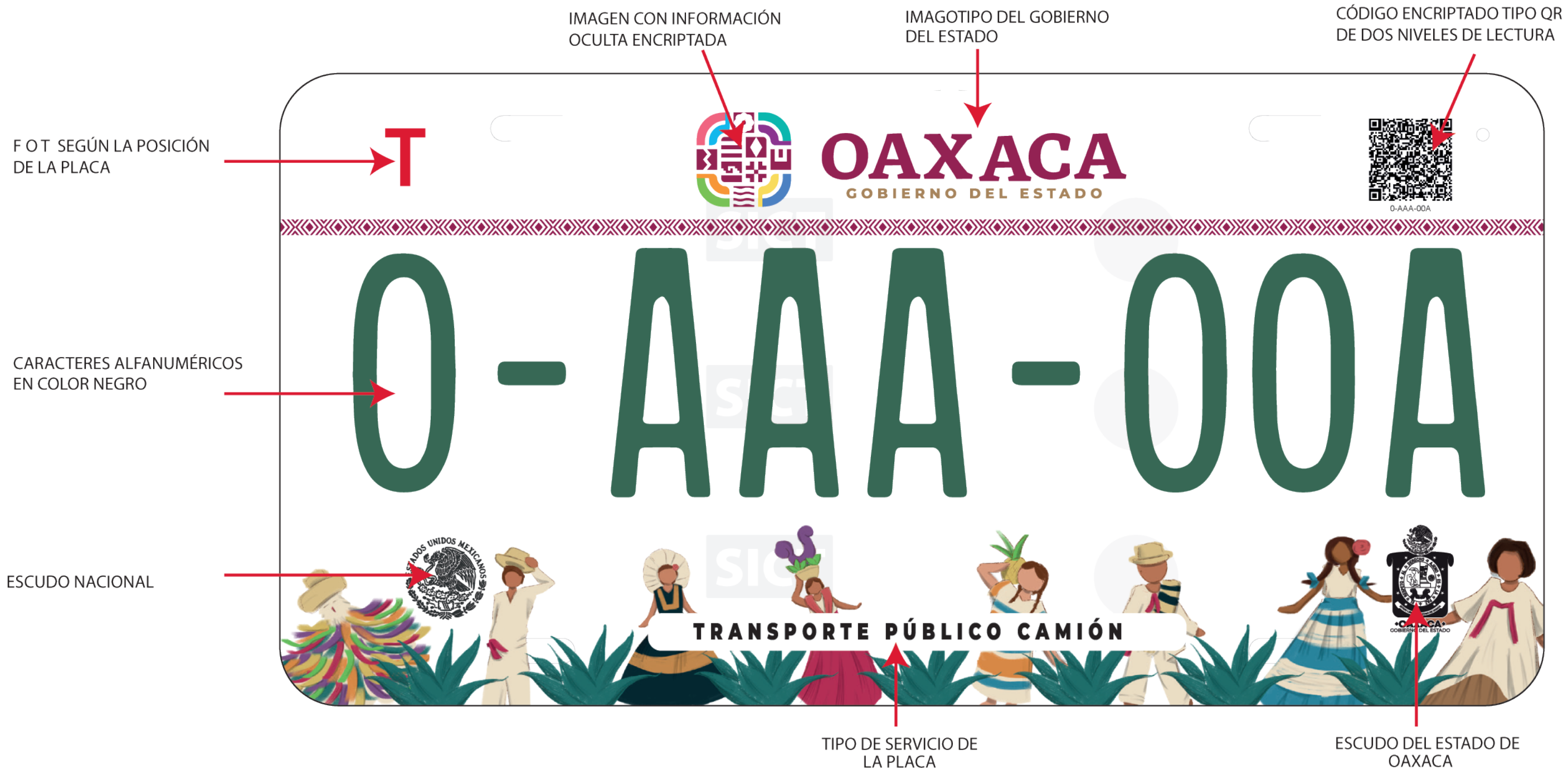
IMAGEN CON INFORMACIÓN OCULTA ENCRIPTADA