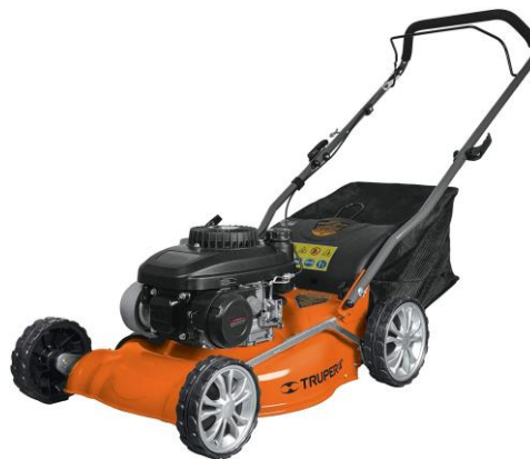
Imagen (únicamente como referencia)