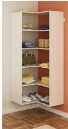
Imagen (únicamente como referencia)