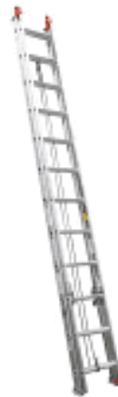
Imagen (únicamente como referencia)