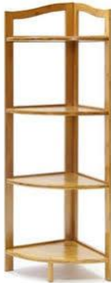
Imagen (únicamente como referencia)