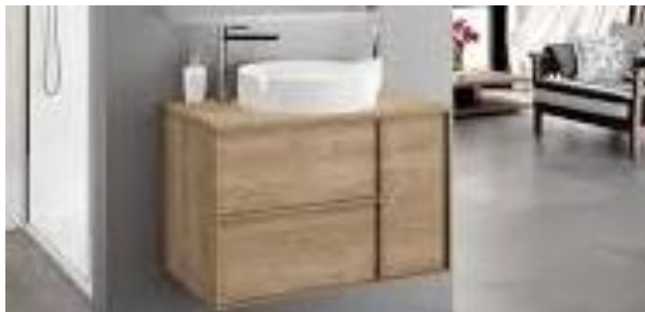
Imagen (únicamente como referencia)