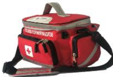
Imagen (únicamente como referencia)