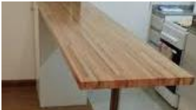
Imagen (únicamente como referencia)