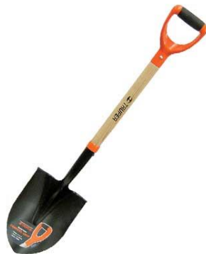
Imagen (únicamente como referencia)