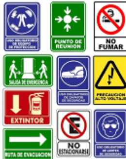
Imagen (únicamente como referencia)