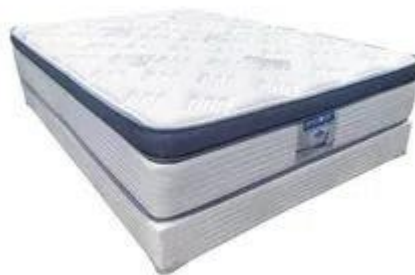
Imagen (únicamente como referencia)