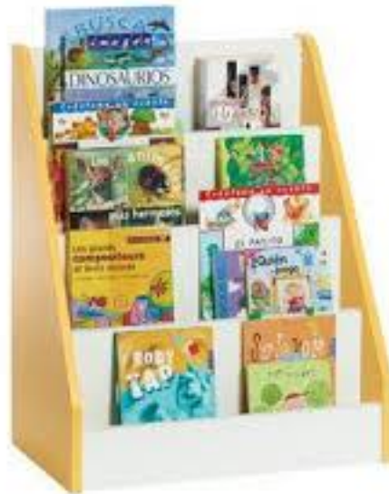
Imagen (únicamente como referencia)