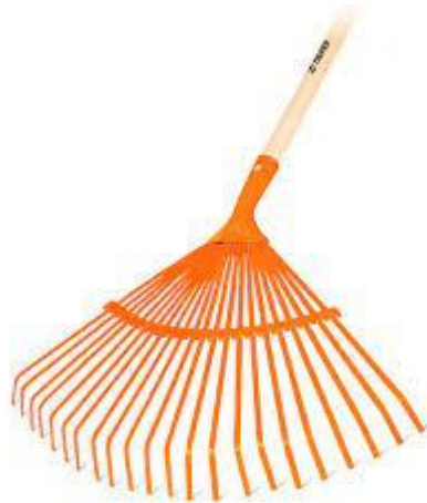
Imagen (únicamente como referencia)