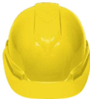
Imagen (únicamente como referencia)