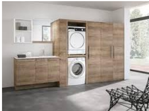
Imagen (únicamente como referencia)