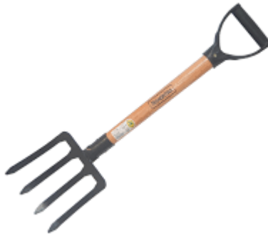
Imagen (únicamente como referencia)