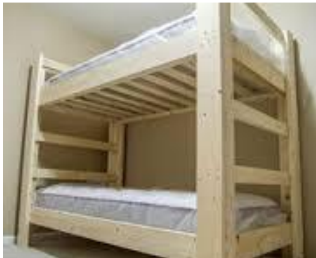
Imagen (únicamente como referencia)