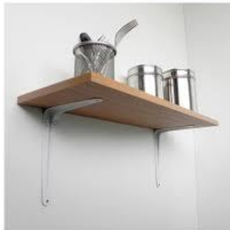
Imagen (únicamente como referencia)