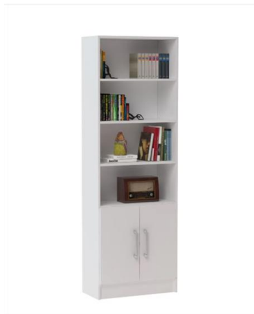
Imagen (únicamente como referencia)