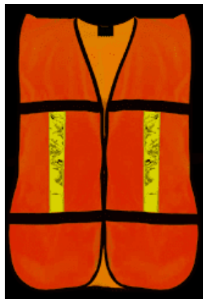
Imagen (únicamente como referencia)